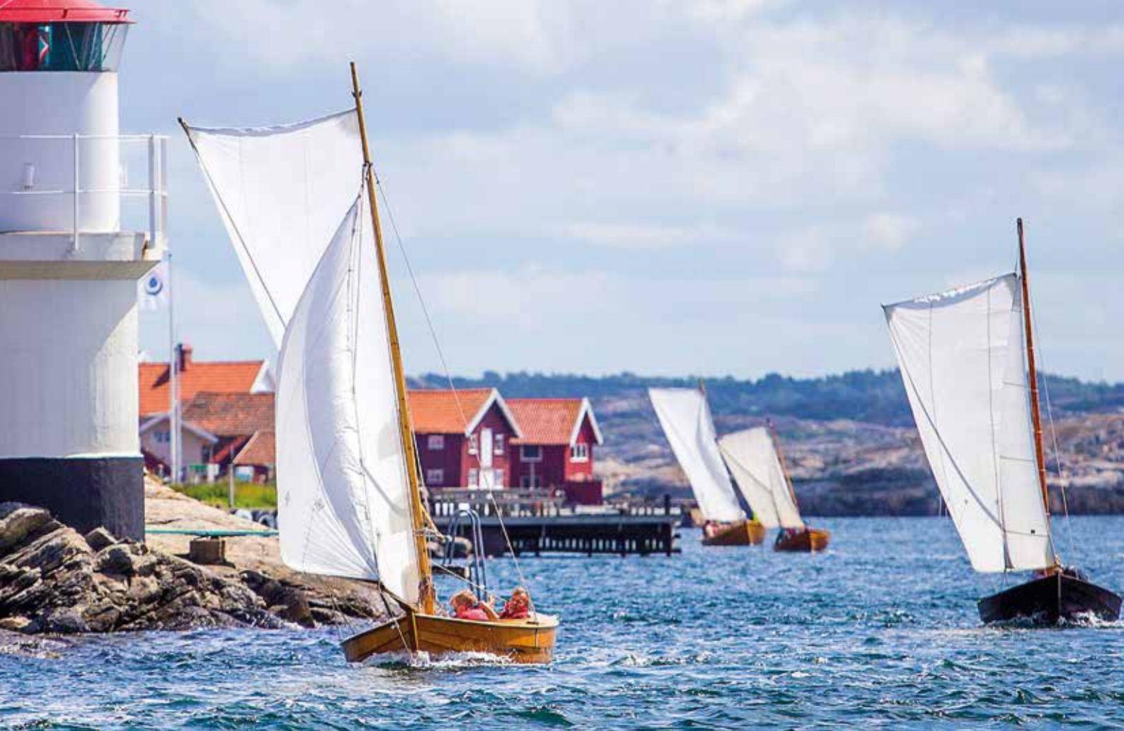
Bohusjullarna passerar Mollösunds fyr nedanför Galgeberget.