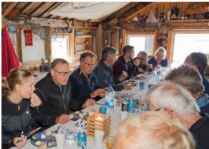
God stämning i fiskeboa före start.