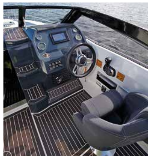
Förarplatsen i C61 Cruiser är enkel och funktionell. Tyvärr stör sidobalkarna sikten kraftigt.

ASKELADDEN C61 CRUISER har moderna lösningar och bra komfort, vilket gör den till en fullvärdig och praktisk daycruiser. Men den är också en hel del dyrare än de här konkurrenterna. Båten ingår i en hel familj med modeller baserade på samma skrov (även C61 Bowrider och C61 Center). Det samma gäller för både Bella 620 och Ryds 628, som också har flera olika däckslösningar på sina respektive skrov.