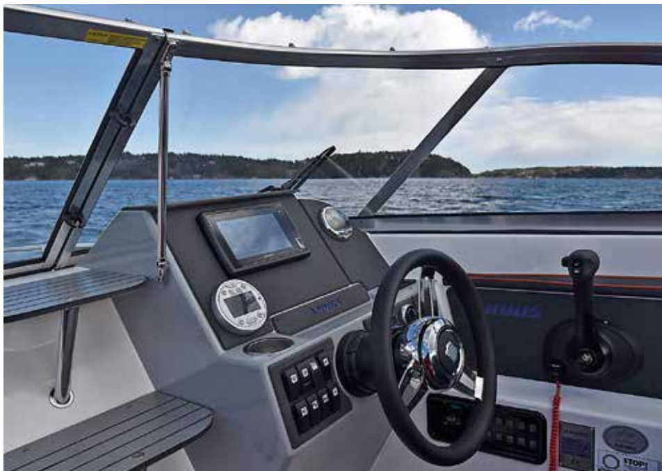
Ryds förarplats är väl skyddad bakom vindrutan.