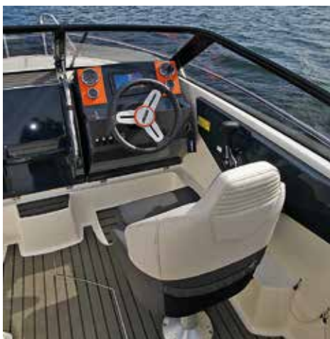
Bellans förarplats är genomtänkt med bra sikt. Färgsättningen med glatt orange har tonats sedan de första båtarna med nya stilen presenterades.