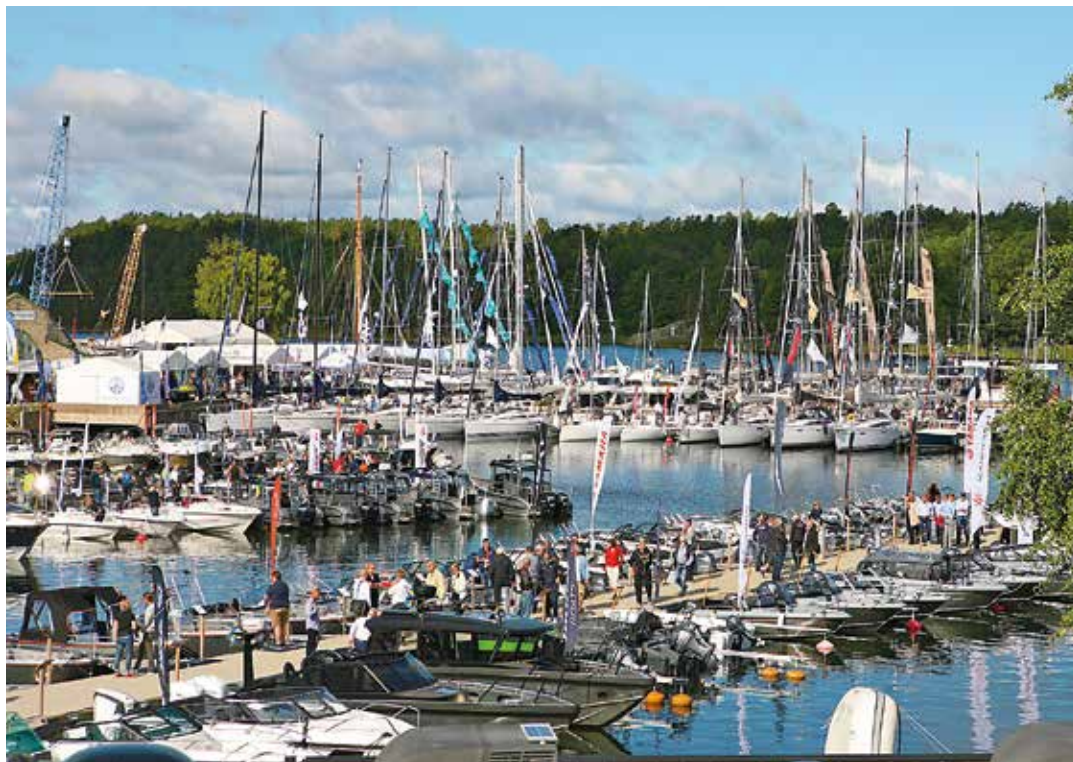
Allt på Sjön i Gustavsberg har Nordens största utbud av båtar.

En av mässans största segelbåtar – Lagoon 52 – kom inte under Gustavsbergsbron, utan fick ligga på redde i en vik utanför. Denna nya modell har en sittbrunn som ligger i nivå med salongen. Styrplatsen ligger uppe på flybridge, och den är "flyttbar" från babords till styrbords sida. Mått 15,8x8,6 m. Djup 1,5 m. Segelyta 160 m 2 i stor och foc. Motor: 2x54 hk Yanmar. www.navigare-yachting.com