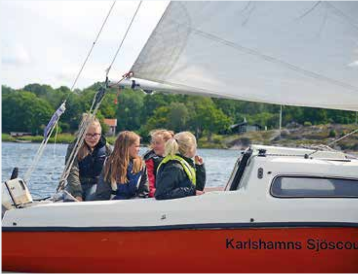
Deltagarna lär sig grunderna i segling och motorbåtskörning och hur man färdas säkert på havet. Fler bilder på www.batliv.se