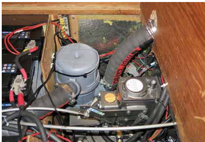
Bilden visar avgasslangen från motorblocket till vattenlåset och erforderlig fallhöjd, ca 30 cm, för att undvika att kylvatten rinner in i motorn bakvägen. Det cylinderformade vattenlåset är lätt att placera i trånga utrymmen.

Båtägaren valde att använda samma vattenlås/ljuddämpare som till förra motorn. Vid certifieringen kontrollmättes fallhöjden för avgaserna från motorn mot vattenlåset och det visade sig att den var för låg, bara cirka