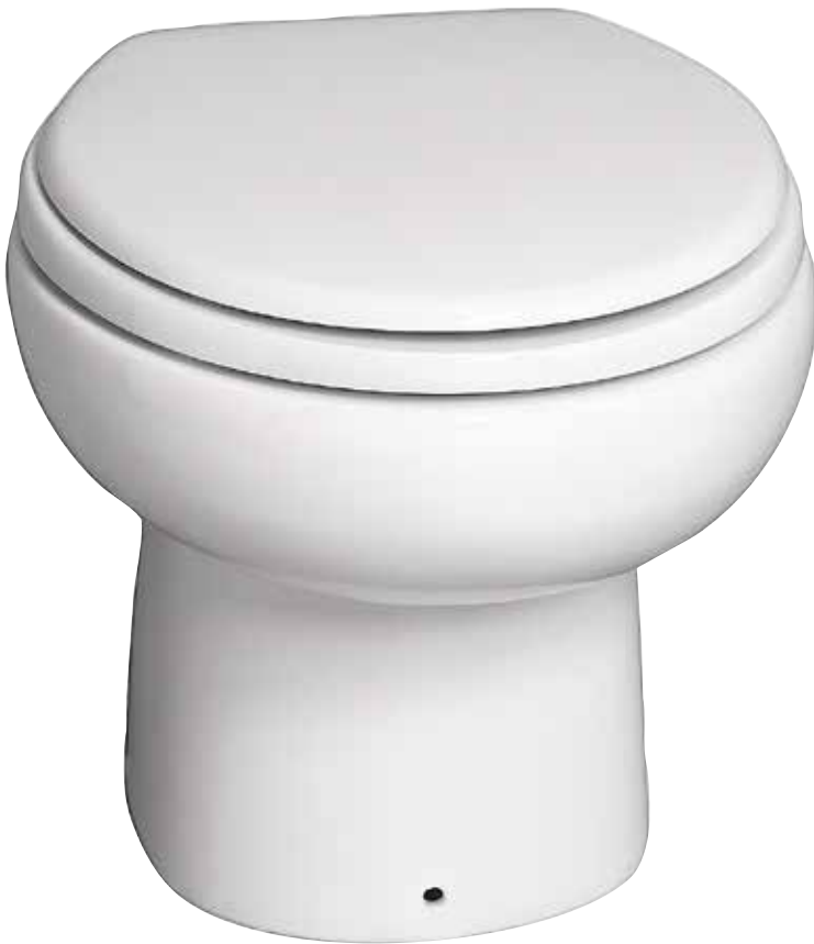
Snålspolande eltoalett från Sanimarin, modell SN31.