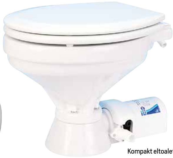
Kompakt eltoalett från Jabsco.