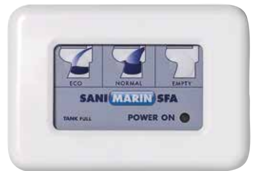
Elektronisk kontrollpanel för hel/halvspolning samt hel tömning av toalettstolen vid t ex grov sjö.