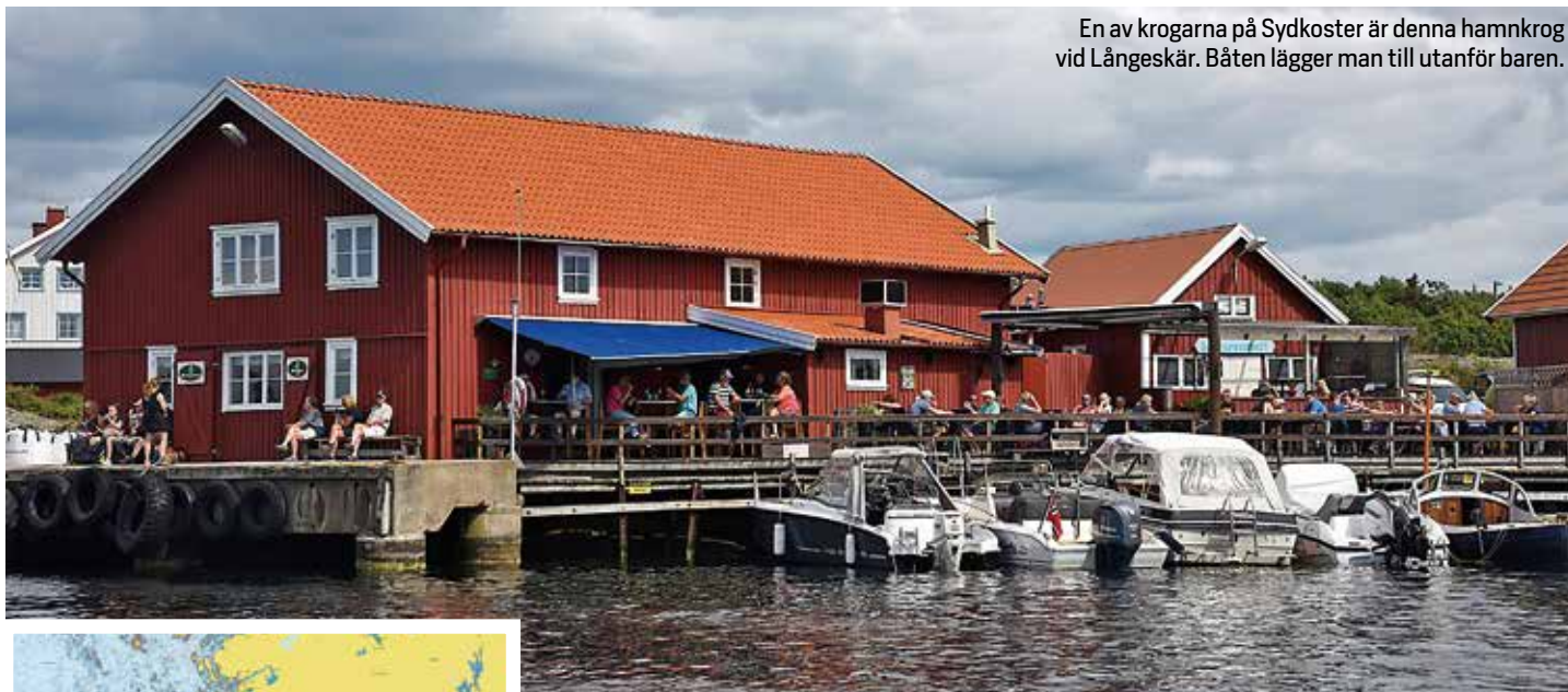
En av krogarna på Sydkoster är denna hamnkrog vid Långeskär. Båten lägger man till utanför baren.