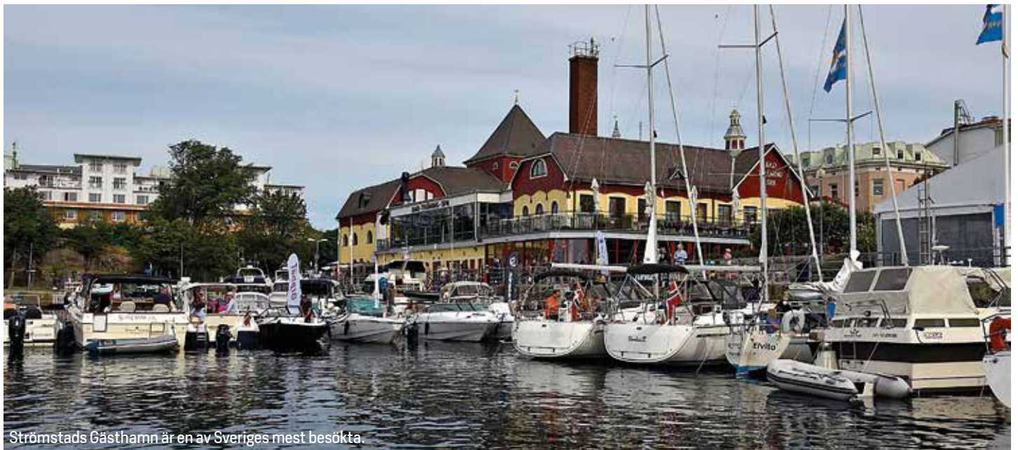
Strömstads Gästhamn är en av Sveriges mest besökta.