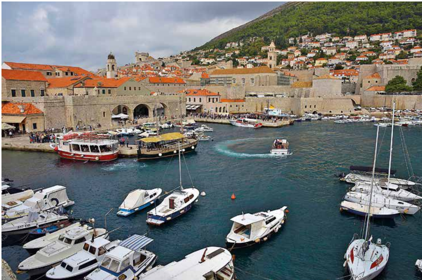
Dubrovnik är en hamnstad med en mycket spännande historia.