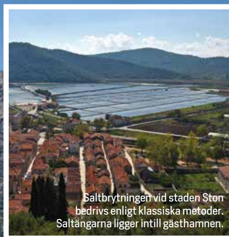
Saltbrytningen vid staden Ston bedrivs enligt klassiska metoder. Saltängarna ligger intill gästhamnen.