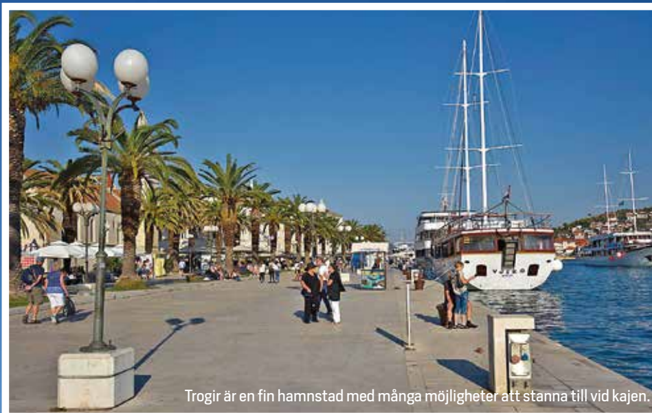
Trogir är en fin hamnstad med många möjligheter att stanna till vid kajen.

I den här viken söder om staden Korcula finns gott om plats för seglare att ankra för natten.