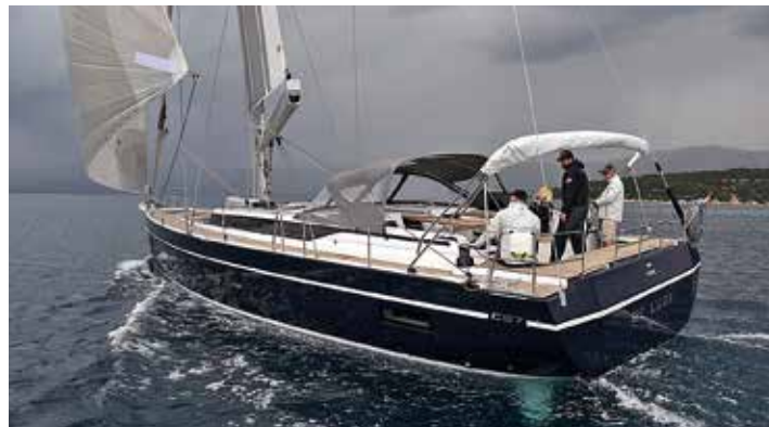
Bavaria har begärt sig själva i administration.

med att bolaget är sålt innan tidsfristen har gått ut. Man förhandlar med eventuella köpare, men ingenting är officiellt än. Målet är att ha en lösning på plats innan semestern i augusti även om detta är en ganska tajt tidsplan.