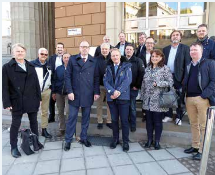
Representanter från riksdagens Fritidsbåtsnätverk, Sweboat och SBU.