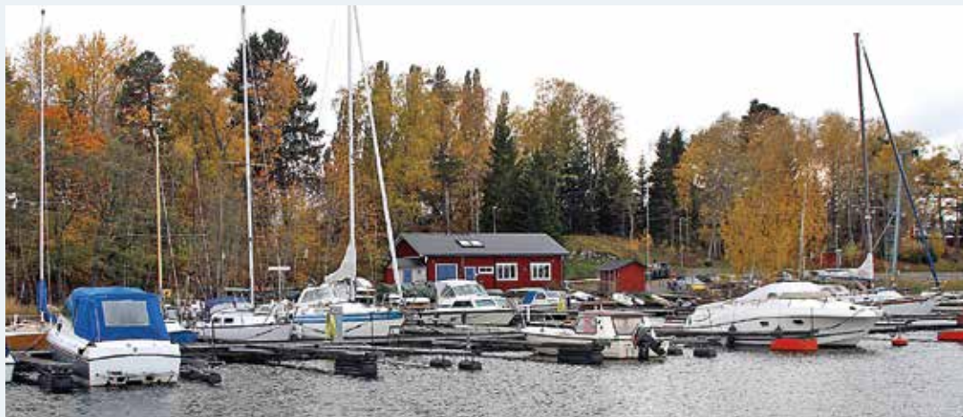
Hamnen i Norrtälje.

– Nej, inte ett dugg. Ändå vill de framstå som en skärgårdskommun och berättar gärna hur nära det är till havet och vad fint det är om man har båt.