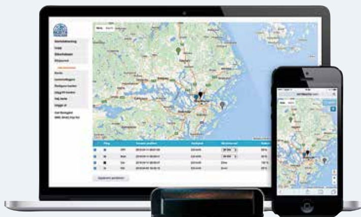
NorthTracker larm för båten säljs av bland andra Watski.

Med ett larm kopplat till en larmcentral går larmet först dit.