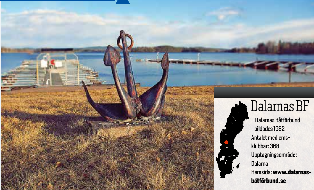
Ornsås Båtklubbs båthamn.