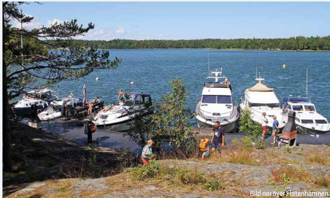
Bild ner över Flatenhamnen.