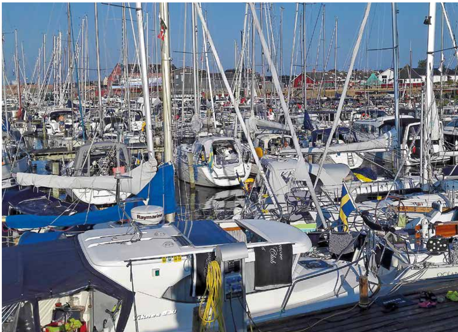
Österby hamn på Läsö är en av de gästhamnar som har flest svenska besökare. Båtlivs skribent blev liggande här i tre veckor under sommarens högtryck.