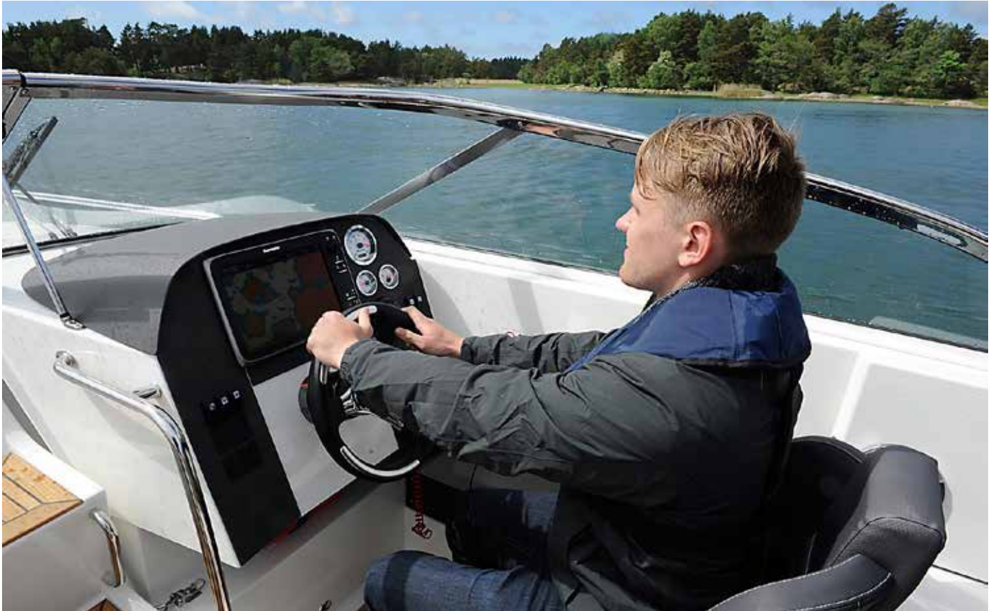
Enkel och funktionell förarplats med utrymme för en kartplotter.