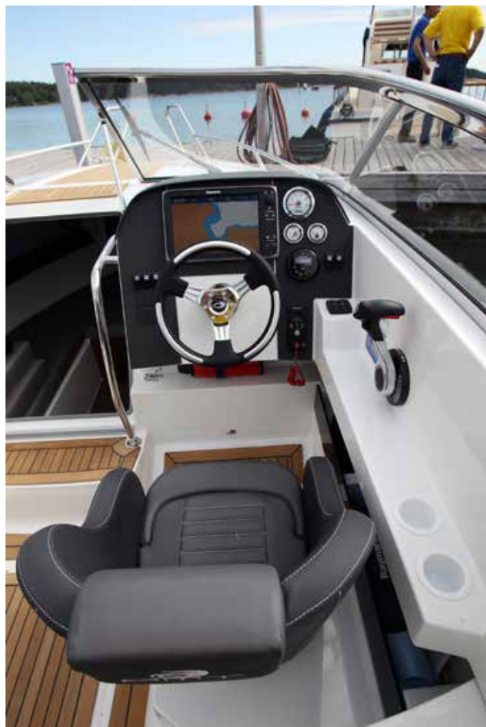
Förarplatsen har antireflexbehandlat material i alla mörka ytor.