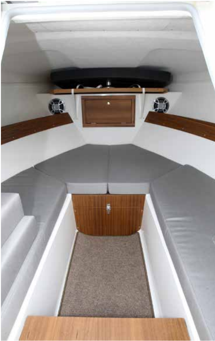
Bra och rymlig kabin med plats för att övernatta.