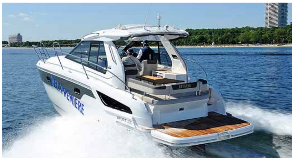
Den öppningsbara hardtoppen ger båten ett högt utseende. Men den är bra utformad och enkel att öppna.