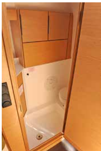
Toaletten är väl utnyttjad med vattentoa och dusch.