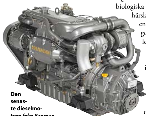
Den senaste dieselmotorn från Yanmar Marine, 4JH4-HTE, är effektiv och lätt men inte heller den japanska tillverkaren rekommenderar biodiesel.

Som om detta inte räcker kommer nästa jobbiga problem när