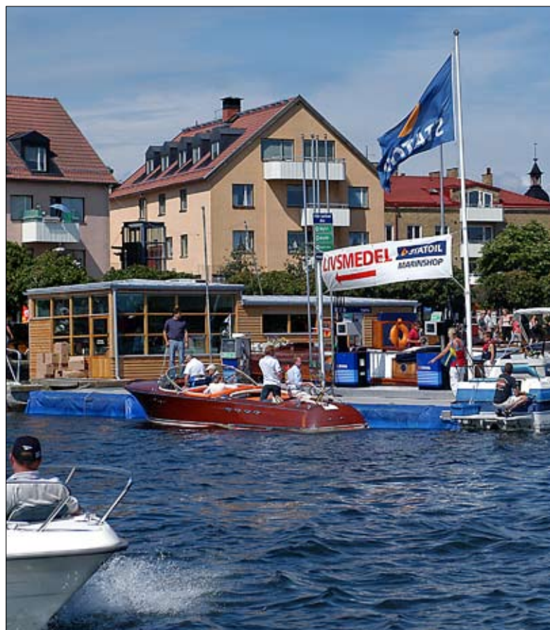
Se upp vid macken i sommar med vilken diesel du köper.

det blir dags att ta upp båten för vintern.