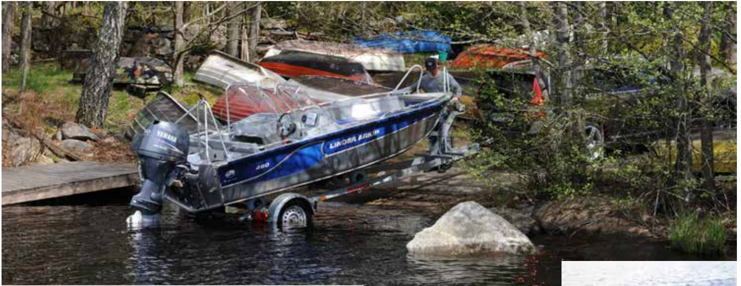
Linder 460 Arkip är enkel att hantera på trailer även för en person.