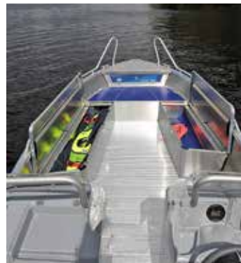
Innerutrymmena omfattar bland annat låsbara fack på sidorna. Båten länsar sig själv via en automatisk länsypump.