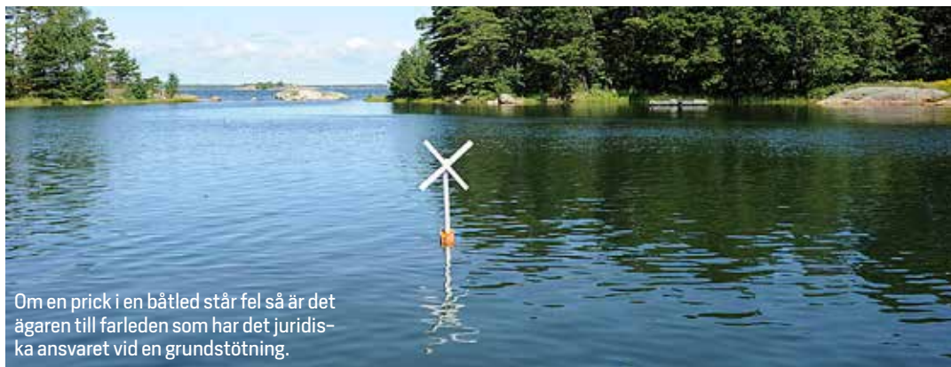
Om en prick i en båtled står fel så är det ägaren till farleden som har det juridiska ansvaret vid en grundstötning.