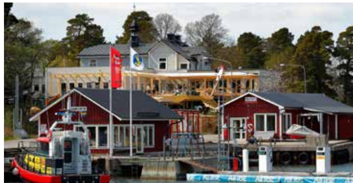
Hotellet i Arkösund är nyrenoverat inför sommaren.

Anrika men tidigare lite skamfilade Arkösunds Hotell fick i år en ny ägargrupp där bland andra finansmannen Fredrik Lundberg och en av