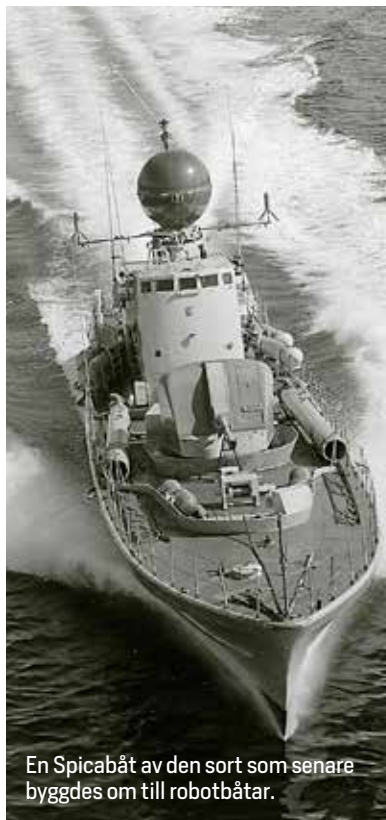
En Spicabåt av den sort som senare byggdes om till robotbåtar.