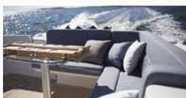
Nimbus 305 Drophead