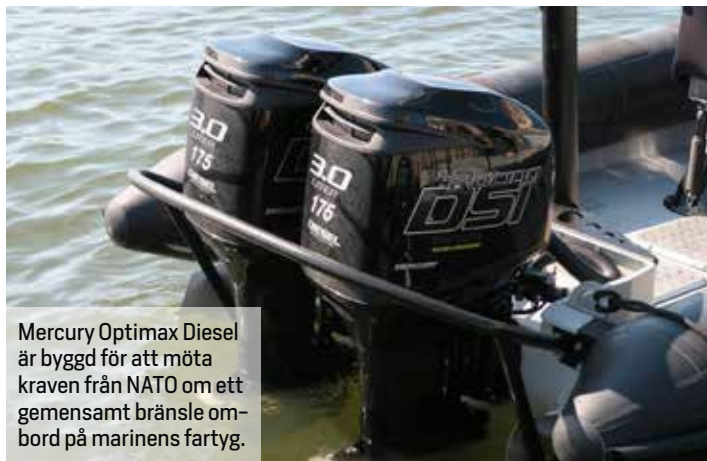
Mercury Optimax Diesel är byggd för att möta kraven från NATO om ett gemensamt bränsle ombord på marinens fartyg.

Efter en mindre testtur i Göteborgs inlopp kan vi konstatera att accelerationen var i nivå med likvärdiga bensinmotorer och något typiskt dieselljud hördes aldrig. Vid max 6 000 rpm drar motorn 60 lit/h, vilket kan jämföras med en motsvarande bensinmotor som drar cirka 80 lit/h.