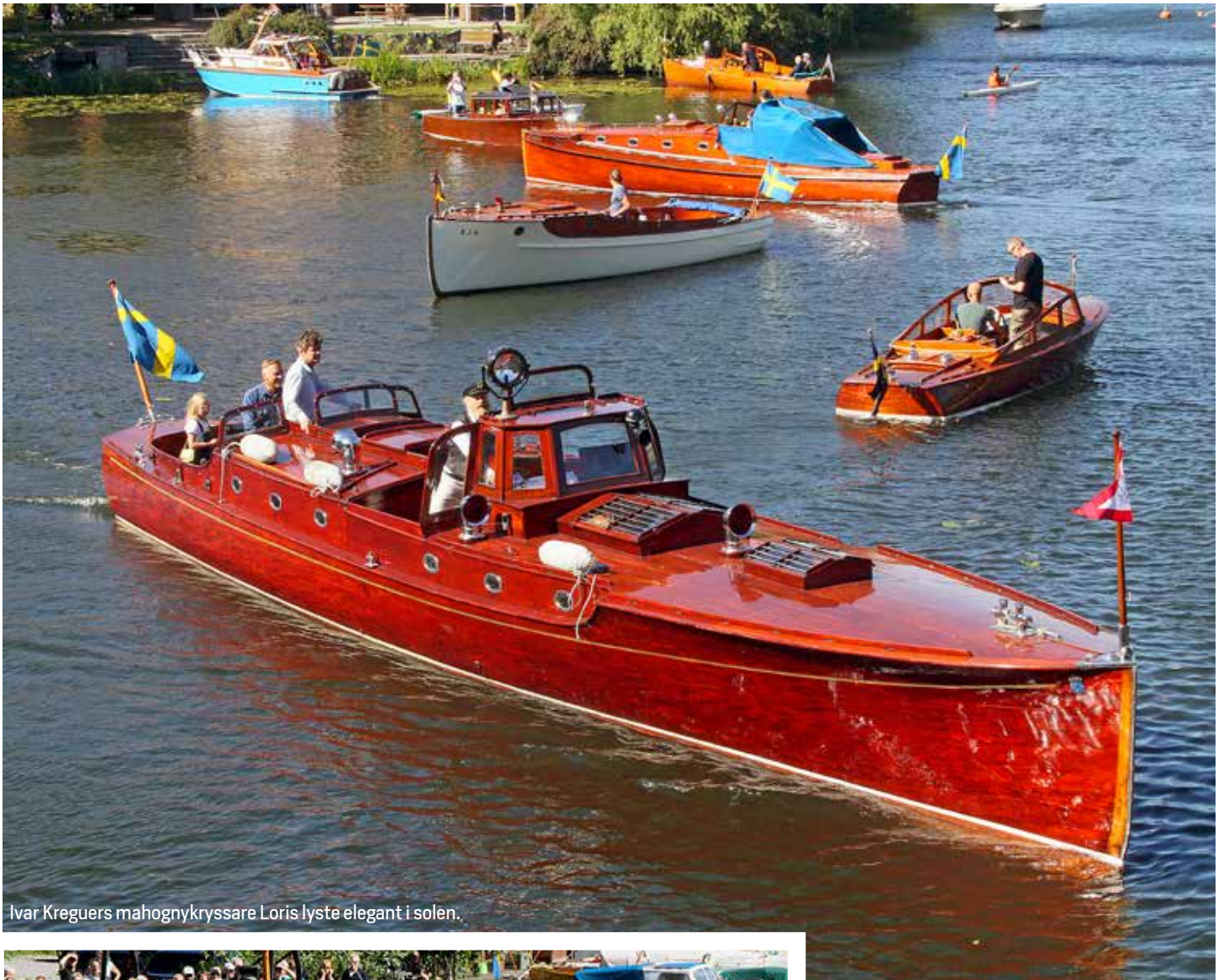
Ivar Kreguers mahognykrussare Loris lyste elegant i solen.