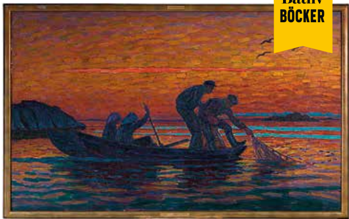
Notdragning i Stockholms skärgård, 1915, olja på duk.