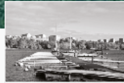
Traneberg Marina Installerad 1983