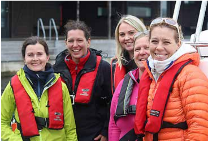
Trötta men glada efter en dag med nya kunskaper.