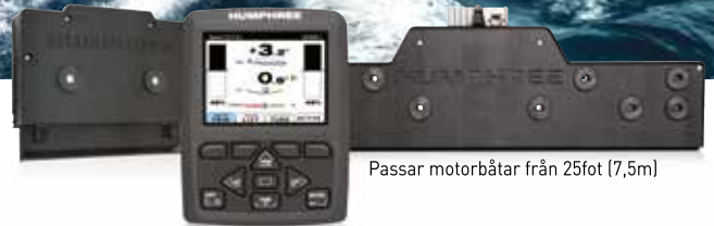
Passar motorbåtar från 25fot (7,5m)