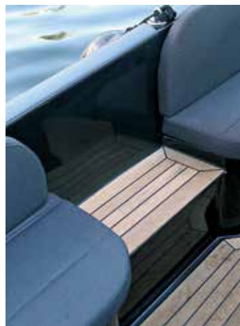
Fotsteg för bekväm ombordstigning.