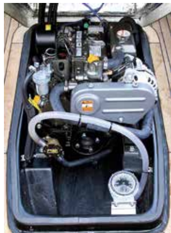
Den trecylindriga Yanmardieseln.