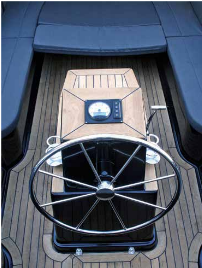
Styripedestalen är centralt placerad i båten. Som tillval finns extra dynor, vilket gör snipan bäddbar för den som vill ta igen sig efter båtturen.