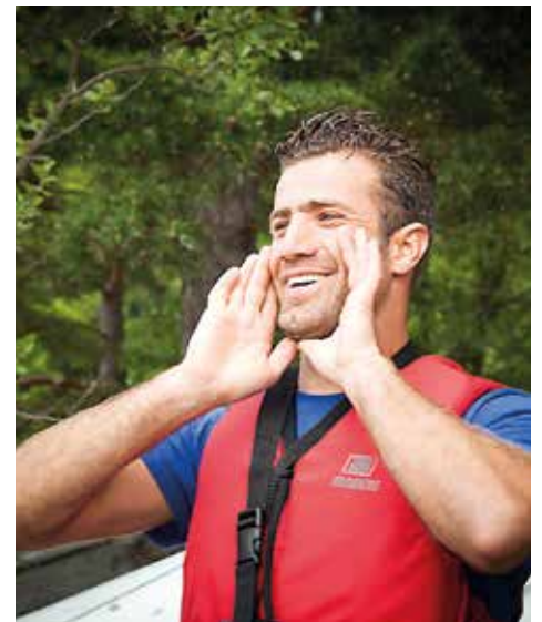
Bolus från Syrien.

vardera. Jag inser att det är för lite och det kommer sannolikt att höjas, men jag vill ju inte att pengar ska vara ett hinder för folk att kunna komma med ut.