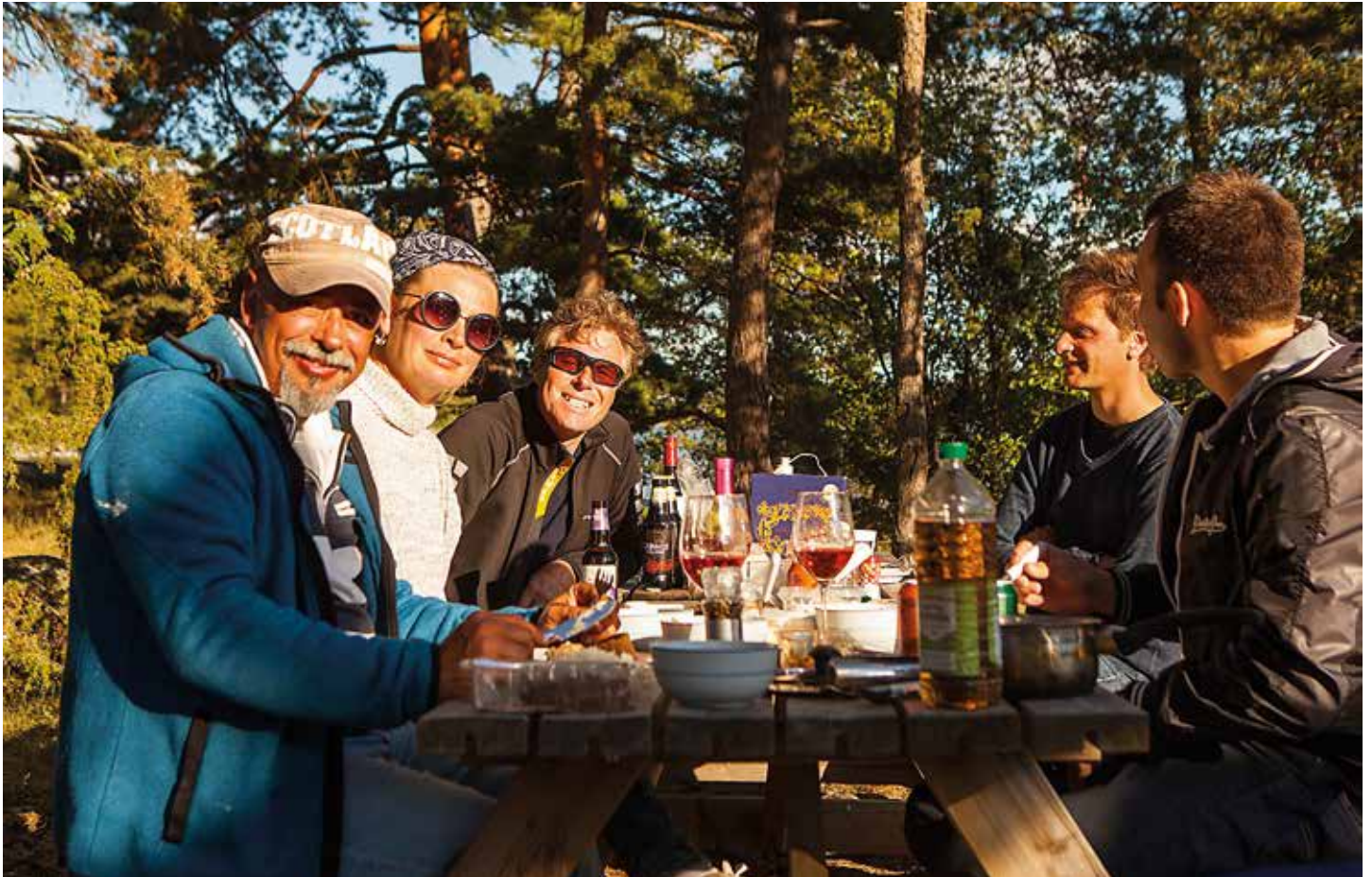
Stämningen var på topp. I år var det sammanlagt 15 segelbåtar med ett trettiotal svenskar och ungefär lika många invandrare utslaget på två evenemang.