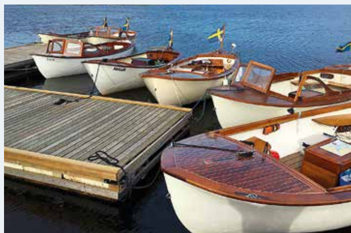
Sjöbjörnsträff på Stora Trutskär i Kalix. I år var det tionde gången.