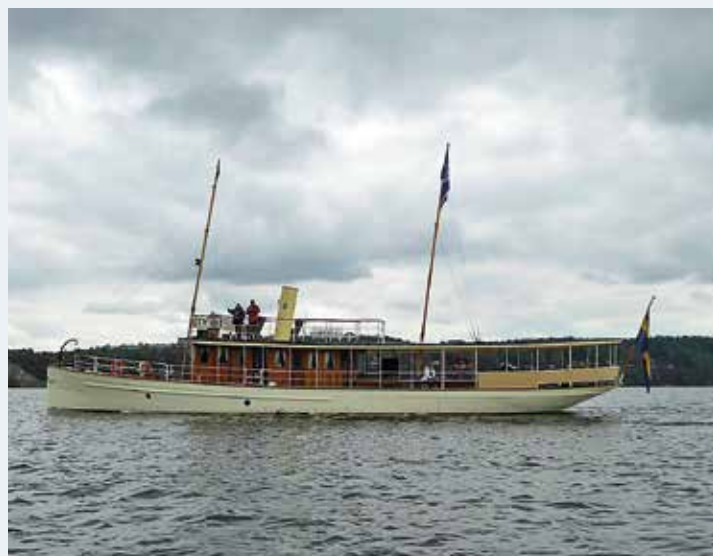
MS Arona har bl. a. gått som skärgårdstrafik i Karlskrona.

EFTER BESÖKET KÄNNER vi ett stort hopp för båtlivets framtid. Inte minst med härligt engagerade och ideellt arbetande ledare samt med underbara båtälskande ungdomar. ☺