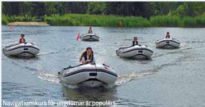
Navigationkurs för ungdomar är populärt.

Du som är medlem i en SBU-ansluten båtklubb får tidningen som en del av ditt medlemskap i organisationen. www.batunionen.se