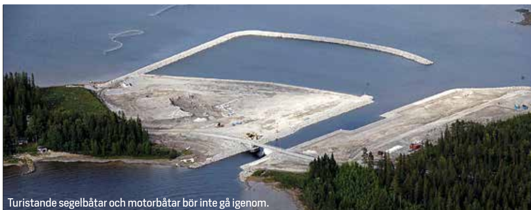
Turistande segelbåtar och motorbåtar bör inte gå igenom.