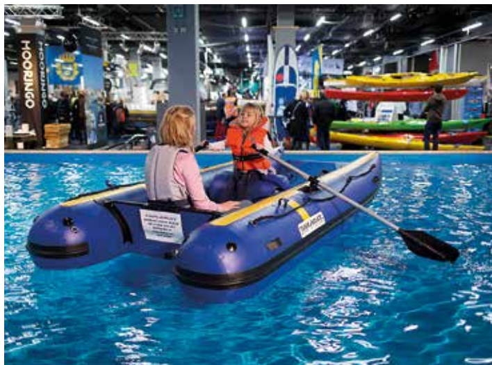
Alla är välkomna till Båtmässan i Göteborg, inte minst båtlivets nybörjare.

Tillsammans med Sportfiskarna, Fiskejournalen och Comstedt AB gör arrangörerna en storsatsning på Sportfiske som ska locka fler besökare till mässan och fler utövare till sportfisket. På mässan kommer