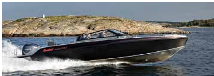
Buster Phantom med dubbla V8:or blir ett av dragplåstren till Allt för sjön.