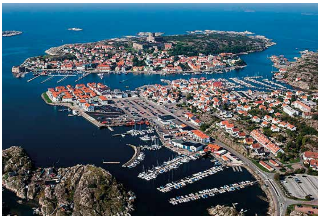
Marstrand Boat Show 25–27 augusti är en ny och attraktiv mässa med många aktiviteter för hela familjen.