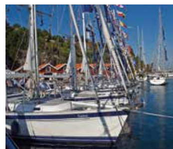
Öppet Varv hålls i Ellös.