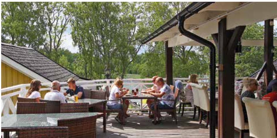
Verandan på Blidö Hamnkrog med gäster.