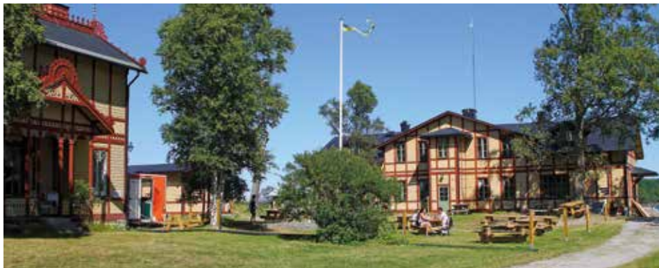
Uteserveringen på Fejan med vandrarhemmet i bakgrunden. T.v. ser vi f.d. läkarhuset Kongo.