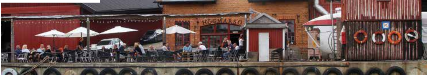
Vy över Restaurang Varvet från sjön.