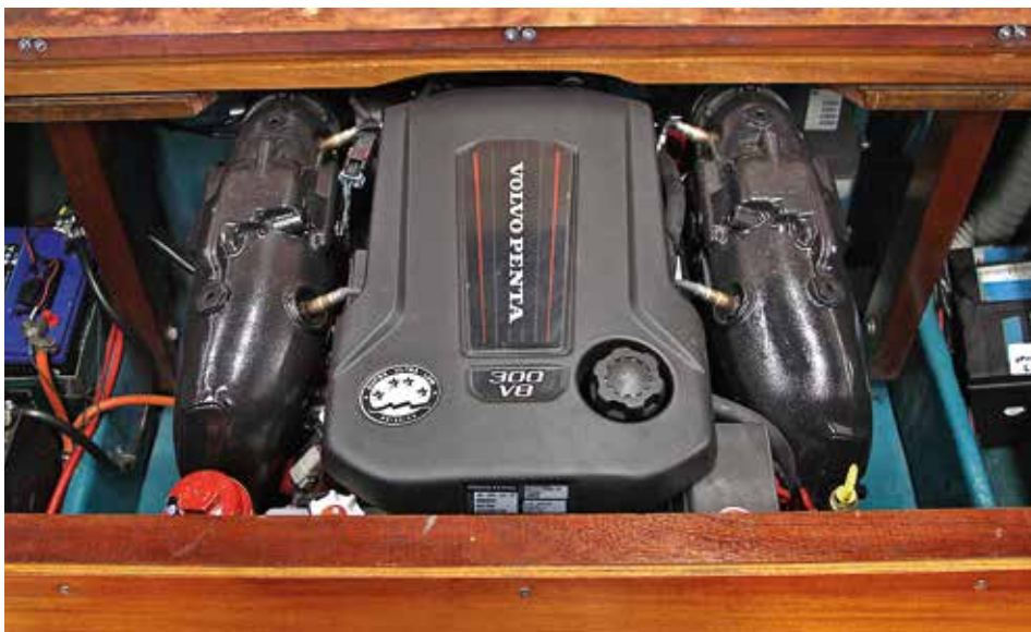
Den nya motorn på plats i motorrummet.