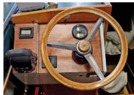
Instrumentpanelen efter motorbytet.