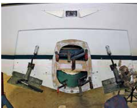
Akterspegeln förbereds för det nya drevet.