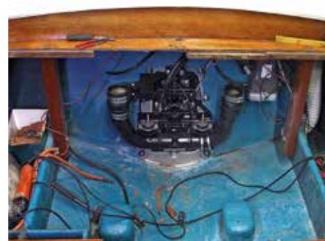
Den gamla motorn är urmonterad. Skölden är på plats och monteringen av nya V8:an kan börja.

Steffo Törnquist är inne på sin tredje motor i sin Coronet DC 21 från 1968. Med ny bensin V8 gör båten närmare 50 knop och marschar fint runt 30 knop.