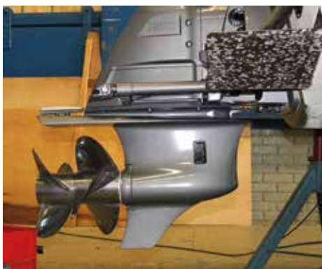
Det nya drevet på plats.