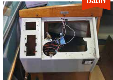
Instrumentbrädan har gjorts om utan att förändra båtens stil för mycket.