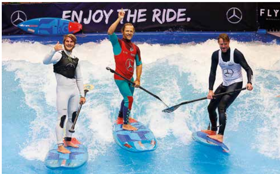
Beachworld och "The Wawe" med en 65 m lång aktivitetspool är rena paradiset för alla vattensportare.