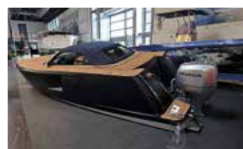
Den här "Audibåten" var ett festligt hembygge i aluminium med inredning och cabb från en A4. Tyvärr var finishen inte särskilt hög.