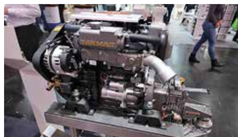
Yanmar 3JH40-SD60 är en ny commonrail-diesel på 40 hk vid 3 000 rpm. Vikt 243 kg.