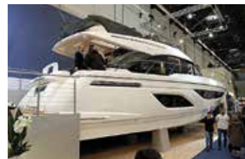
Bavaria R55 är det tyska varvets nya flaggskepp på motorbåtssidan. Båten byggs vid ett varv i Kroatien och är på 16,71x4,75 m. Grundpris 950 000 Euro med 19 % tysk moms.