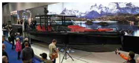
Axopars "Brabusbåt" är elegant svartlackerad, alla detaljer håller högsta klass och hela båten är ordentligt påkostad. Priset är 4 Mkr jämfört med en standard Axopar 37 för cirka 2,5 Mkr (med mindre motorer). Axopar och Brabus planerar att bygga 20 båtar av Brabus Shadow 800 i en första serie och om samarbetet fungerar utöka upp till 45 fot.