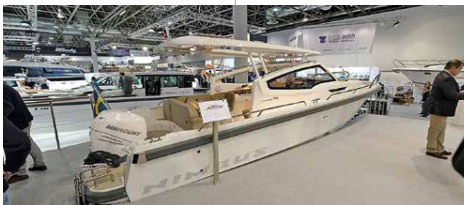
Nimbus Weekender W9 har en maxfart på drygt 40 knop med 350 hk utombordare. Den nya serien kommer att finnas tillgänglig i tre skrovlängder 8, 9 och 11 meter och i tre versioner för specifika användningsområden.