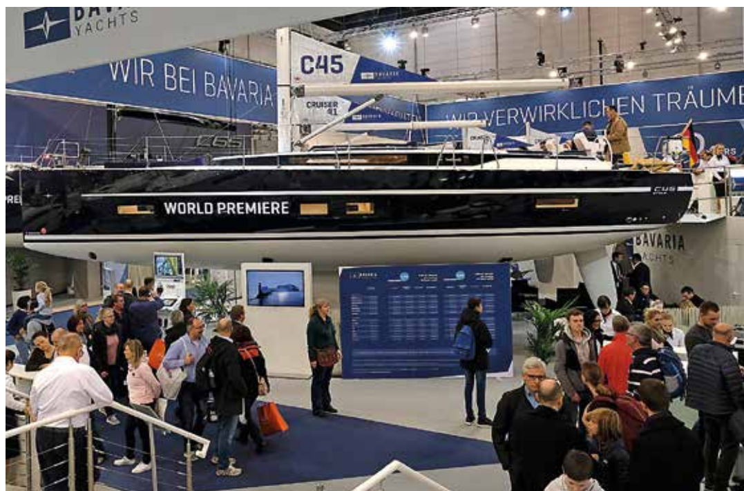
Bavaria C45 på 13,98x4,49 m var en av totalt åtta premiärer från Bavaria, som visades intill flaggskeppet C65.