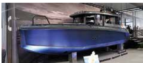
XO Explorer är byggd på samma skrov som XO Cruiser och levererar tuffhet i en stenhård förpackning. Det är en kompromisslös båt med tuff design byggd för skärgårdens alla förhållanden. Liksom alla XO båtar har den här modellen aluminium i militär standard, lång vattenlinje och djup V-botten.