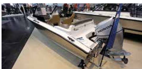
Nya Silver Fox finns i två varianter: Avart och BR. Båten är tillverkad med Silvers slutna sidopontonkonstruktioner i skrovsidorna, som gör båtarna vridstyva, balanserade och trygga.