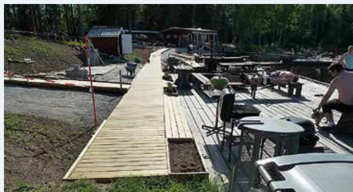
Töre Båtklubb har gjort sin anläggning på klubbholmen mer tillgänglig även för rörelsehindrade.