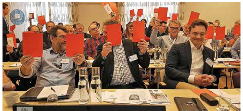
Med stor majoritet röstades Svenska Seglarförbundets årsmöte – Seglardagen – för att även medlemsklubbarna ska ha rösträtt på Seglardagen.