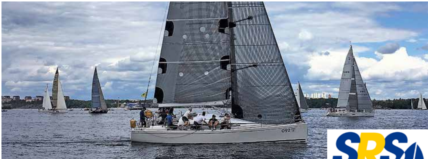
Brommabåten Imperiet II (en Arcona 380) tog hem slutsegern i SRS 2017. På bilden har starten av ÅF Offshore Race 2017 precis gått och även där var det Imperiet II med skepparen Paul Nord som tog hem totalsegern i hela racet.