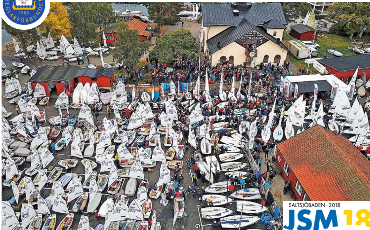
Bilden är från KSSS Olympic Class Regatta 2017 då cirka 500 jollar kappseglade på Baggensfjärden. Och minst lika många lär komma till sommarens JSM.