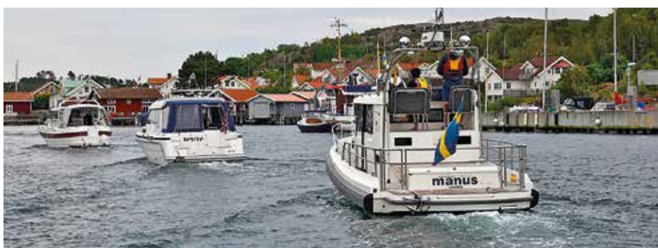
På väg in i Hamburgsund norrifrån.

EFTER ÖVERNATTNING PÅ vackra Väderöarna drar vi in mot kusten igen och fortsätter söderöver längs "E4:an" ner till vårt slutmål i Smögen.