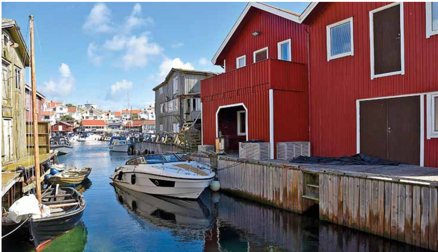
Reportagebåten i Bohuslän var en Grandezza 25.