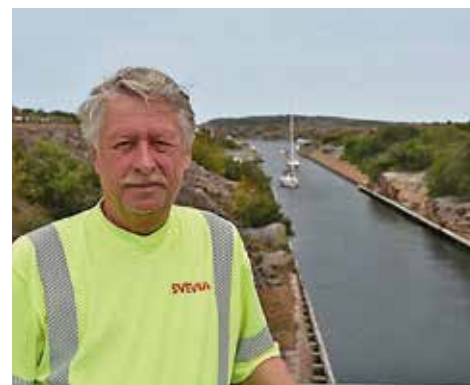
Brovakten har koll på trafiken i Sotekanalen.

2016 LANSERADES ÄVEN Docksurf, en tjänst som innebär att man kan hyra sovplats i en båt vid kaj. I Smögen fanns förra sommaren bland annat en klassisk träbåt som användes till detta. I framtiden kanske även detta blir ett sätt att få vara på sjön. ☺