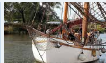
Skutan Westvind. Byggd 1914 i Kungsviken på Orust. Hemmahamn Göteborg. Mått 14,6x5,62 m.

Nästa Sjöbjörnmöte hålls 2019 på Hastaskärsgrund utanför Storöns fyr. http://www.sjobjorn.nu/