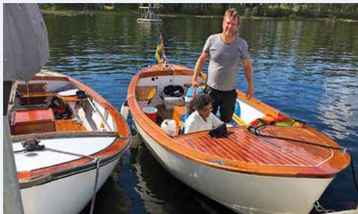
Familjen Lundholm blev sjätte båt till årets Sjöbjörnmöte i Bottenviken. Text & foto: Janne Sparrman

– Äntligen. Vi ses en lördag i slutet av sommaren varje år. Att få ta sin Sjöbjörn och färdas långsamt över