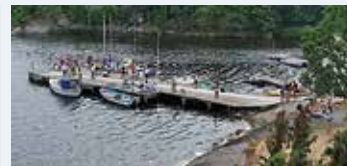
Blekinge Båtförbunds sjösportsläger på Tjärö hade 29 deltagare i år.