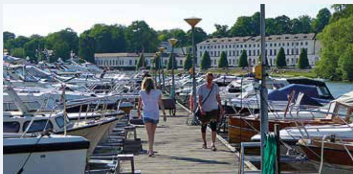
Bryggan med Karlbergs slott i bakgrunden.

Rörstrands BK har, som många andra klubbar, fått flytta på sig då Stockholm Stad expanderat. Under slutet av 50-talet började man bygga Klarastrandsleden varför klubben fick flytta uppläggningsområdet från Rörstrand till Margretelund. 2009 byggts tvärbanan ut och klubben blev av med den uppläggningsplatsen under några år. De fick lägga upp sina båtar på tre till-