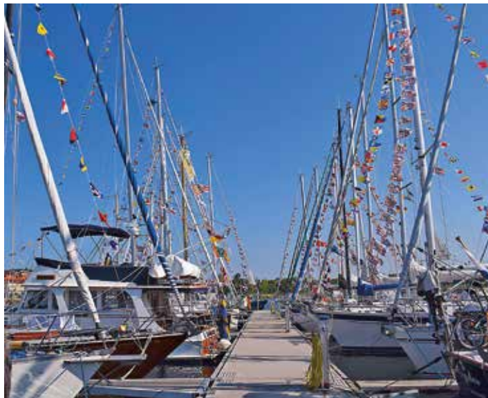
De deltagande båtarna med flaggning vid bryggan.

På Lindholmen, en del av Örlogsbasen och idag en museal ö, imponerades vi av den gamla Polhemsdockan byggd 1724, 74 m lång, 16 m bred och ca 5 m djup. I Wasaskjulet kunde stora fartyg byggas inomhus.