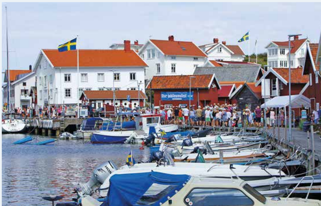
Grundsundsborna gick man ur huse för att fira ”Årets Båtklubb”.

Hamnfesten besöktes av cirka 3 000 personer under festdagarna. Trängseln på en av Väst-kustens längsta bryggor, i över