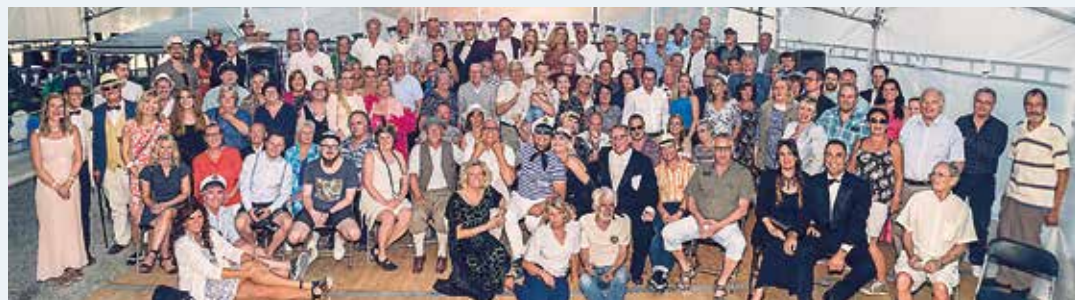
Gruppen från 100-årsfirandet hos Rörstrands Båtklubb.