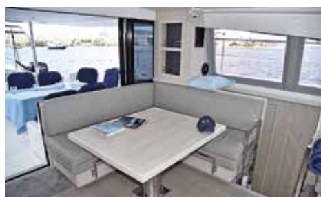
Matplatsen i salongen med direkt anslutning till matplatsen på akterdäck.

De flesta måltiderna intas med fördel på akterdäck, som blir en gemensam enhet med salong när akterväggen fälls ned, eller på den stora flybridgen med plats för 7–8 personer runt matbordet.