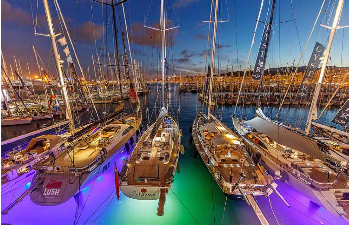
Fem lyxsegelbåtar från Oyster Yachts på parad mitt i Palma de Mallorca med ett sagolikt ljusspel både över och under vattenytan.