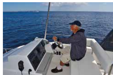
Förarplatsen har god sikt runt om hela båten.

Detta hör dock till undantagen. Mallorca är solsäkert och en plats att rekommendera för alla – med eller utan egen båt. ☺