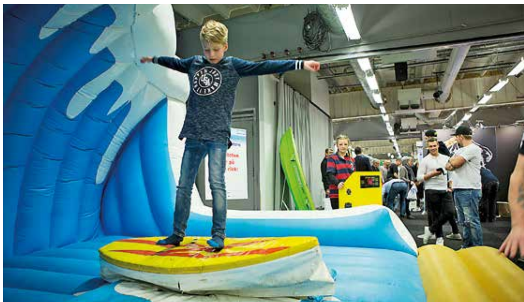
Båtmässan i Göteborg firar 60 år i februari 2019.