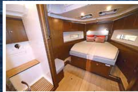
Ägarkabinen är som i en 50-fotare.

Båtens volym gör underverk under däck. Testbåten hade inredning i mörk valnöt, men den kan levereras i ljus ek eller mahogny. Boytan är 60 m 2 och funktionsmässigt bjuder båten på två badrum och tre kabiner samt en stor salong och ett av klassens största pentry. Här finns också rikligt med ljus och luft, gott om luckor i däck. Stora skrovfönster ger bra sikt utåt när man sitter i salongen.