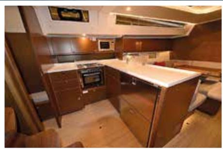
Pentryt är mycket stort med rejäl kylkapacitet.