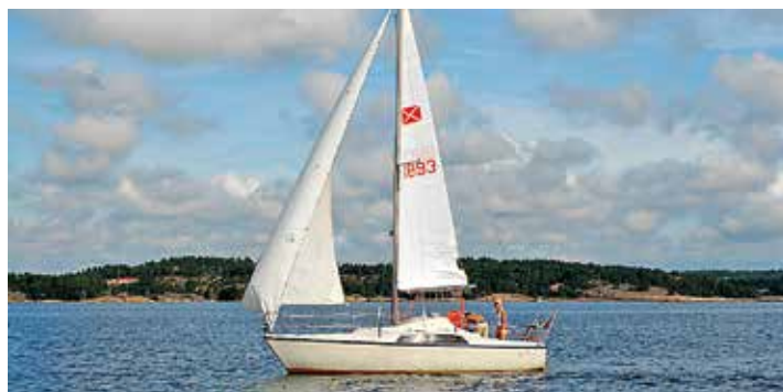
Maxi 77 av Pelle Petterson är en av de mest sålda segelbåtarna.

En HR 310 har idag ett baspris på ungefär 2 Mkr, medan modell 340 är dyrare, kring 2,5 Mkr. Andra liknande skandinaviska båtar är Linjett 34 och Arcona 340, som ligger på drygt 2 Mkr, medan HR 342 hade ett baspris kring 2,3 miljoner sista året den såldes.