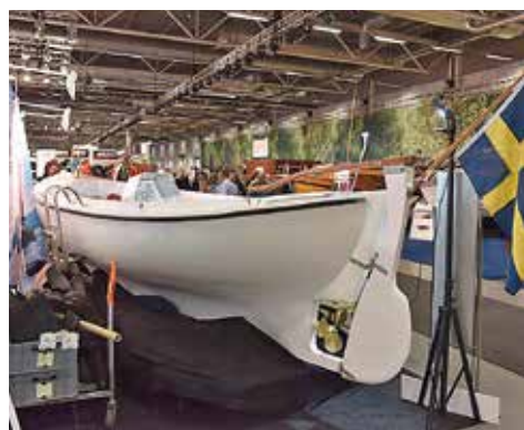
Vikensnipan med en elektrisk inombordsmotor från GreenStar Marin.