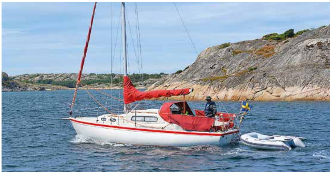
Vega tillverkades i cirka 3 500 exemplar.