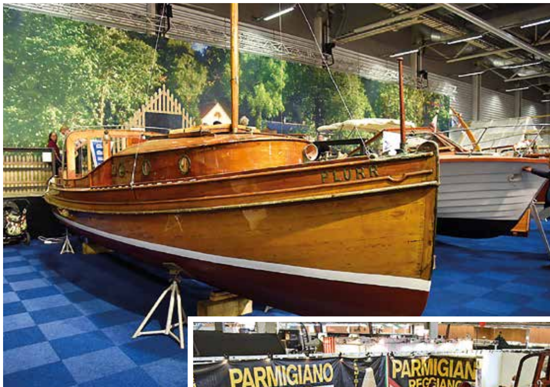
Plurr är från 1905.