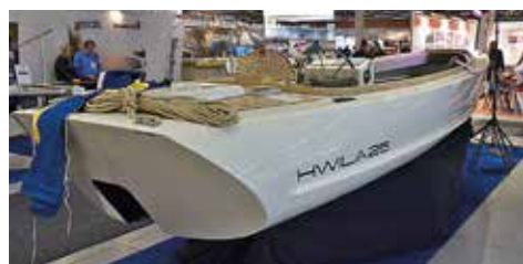
Hwila 25 är en långsmal båt som finns även med elmotor.

Han betonar också den annorlunda upplevelsen av att färdas i elbåt. ⚡