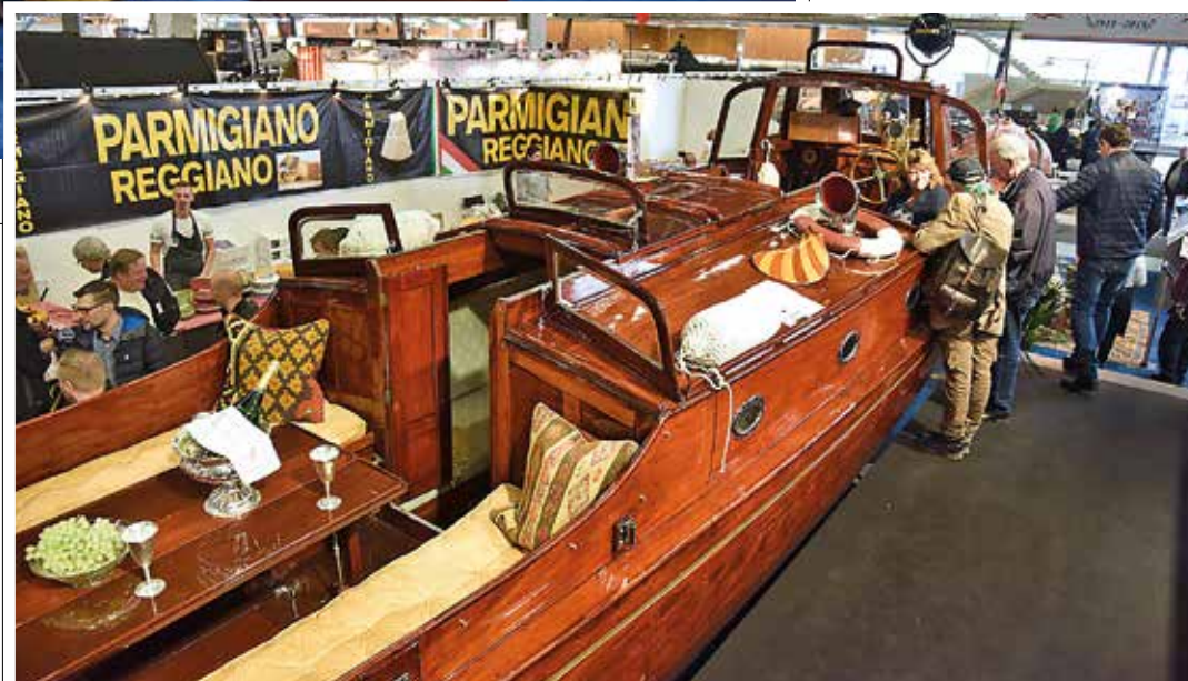
Loris byggdes för finansmannen Ivar Kreuger.