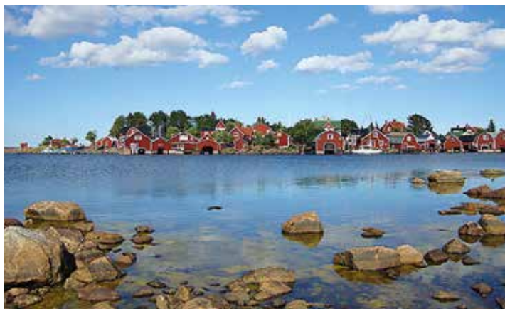
Rönnskärs fiskeläge i Stocka utefter Jungfrukusten, i norra Hälsingland.

Stocka är ett gammalt fiskeläge och sågverksamhålle. Förr fanns här över 30 fiskare och en egen lotsstation. Nu ligger sågen nere och trävirke lastas inte längre. Därför är det gott om plats för gästhamnen med sjömack, restaurang, affär, utställningar, bad och egen flotte ut till Ingaskär där lotsarnas hus är omgjort till museum. Fortfarande är en av Gävleborgs sista yrkesfiskare verksam, hans fiskebod är öppen med färsk fisk och delikatesser.