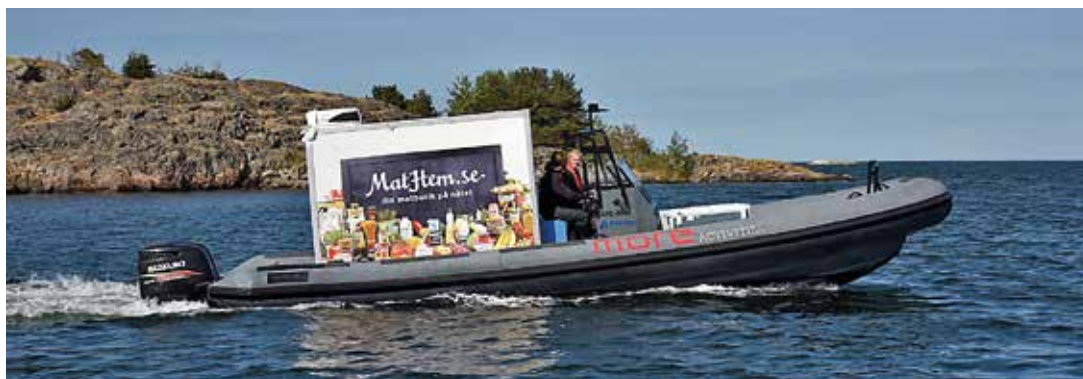
Matbåten kör ut med matkassar i hela Stockholms skärgård. Båten är en Rupert 32 med 2x300 hk Suzuki utombordare.