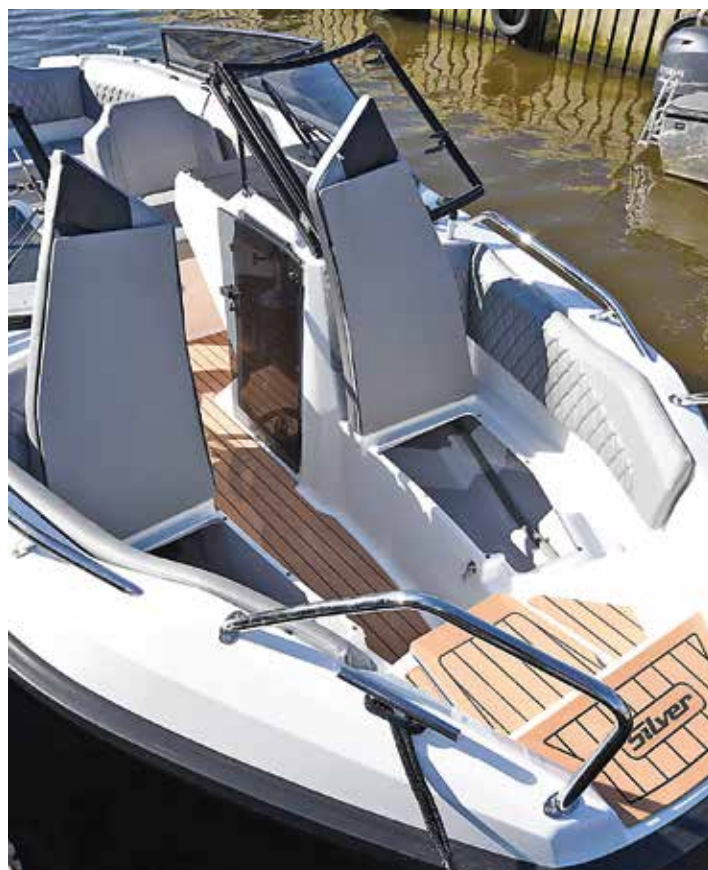
Bowridermodellen är praktisk med ett smart, nedsänkt insteg i båten.

BÅDA SILVER TIGER-MODELLERNA är mycket väldisponerade och funktionella. Särskilt bowridern skiljer ut sig från mängden på ett positivt sätt. DC-versionen är mer traditionell och har en fungerande kabin trots att båten bara är knappt sex meter lång. ☺