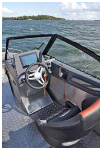
Linjerna i nya Buster XL och XXL känns igen från de större Buster Phantom och Magnum-modellerna. Buster har därmed anpassat sina storsäljare i sexmeterasklassen till ett modernare formspråk.

Buster XXL är något längre än XL, men har samma bredd. Framför allt har den bättre komfort ombord och är godkänd för åtta personer – en mer än XL. Den tillåtna maxeffekten är dessutom 150 hk, något som ger en toppfart på 43 knop.