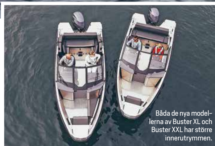
Båda de nya modellerna av Buster XL och Buster XXL har större innerutrymmen.