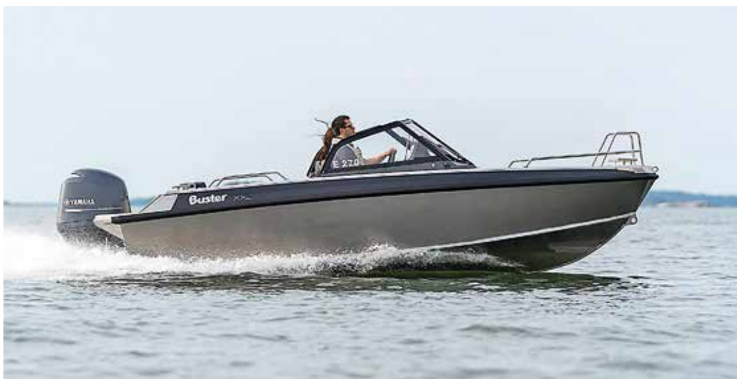
Buster XXL är godkänd för åtta personer (795 kg), vilket är 240 kg mer än föregångaren. Rekommenderat motorstyrka är 115–150 hk. Enligt Buster Boats är bränsleförbrukningen 0,8 lit/Nm vid 19–29 knop.