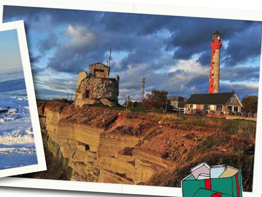
Till vänster fyren på Bonden, Sverige. Till höger fyren på Pakri i Estland.