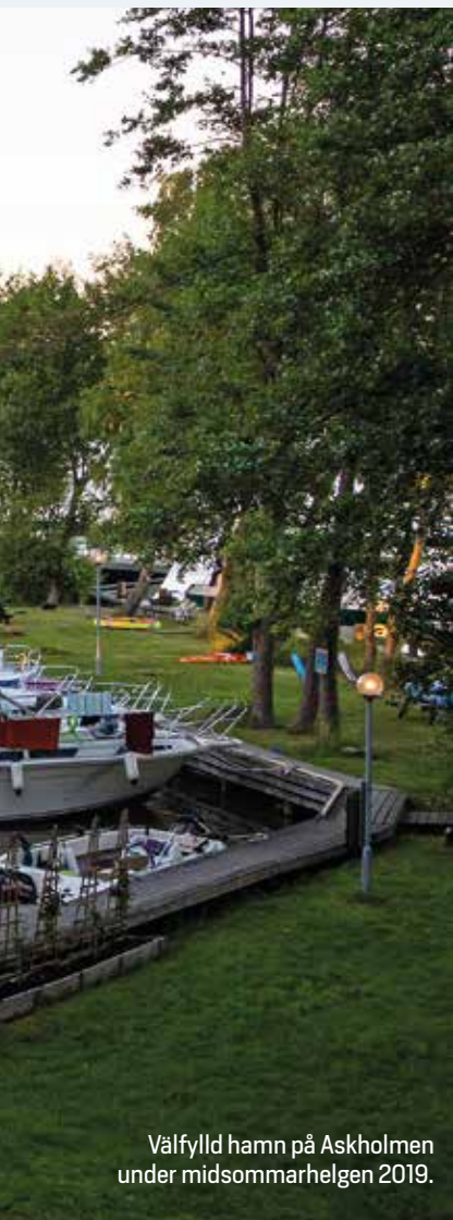
Välfylld hamn på Askholmen under midsommarhelgen 2019.