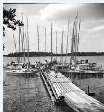
En välfylld brygga på Askholmen 1951, innan dagens hamn byggdes.

Midsommarafton var det som vanligt ett omfattande program och på midsommardagen hade vi bland annat hyrt in vattenskotrar och sup-bräddor som folk fick prova.