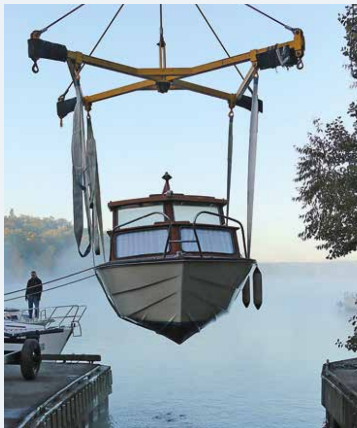
Upptagning med hjälp av egen kran.

– På min tid var det den dominerande gruppen. Nu är det mest folk med grånat hår som är aktiva, säger han och skrattar. ☺