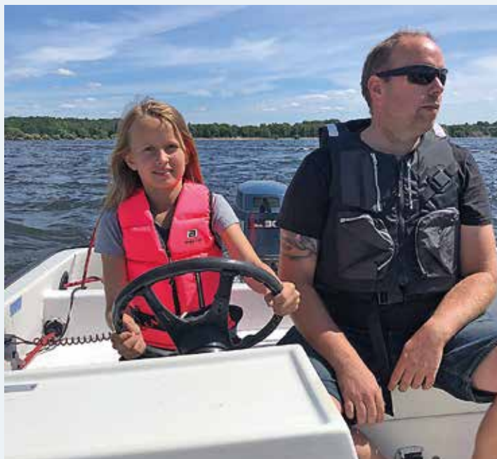
Mjörns Motorbåtssällskap har startat ungdomsverksamhet.

För den teoretiska delen används SBU:s Båtskola, Båtföraren. På sikt planeras att ungdomarna ska genomföra den officiella Förarintygutbildningen. För den praktiska utbildningen vad gäller att ta hand om skrov, motor/drev, utrustning och framförande ansvarar två erfarna båtlivsresurser inom MMS.