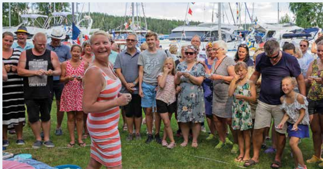
Midsommaraftonens lotteri är alltid populärt.