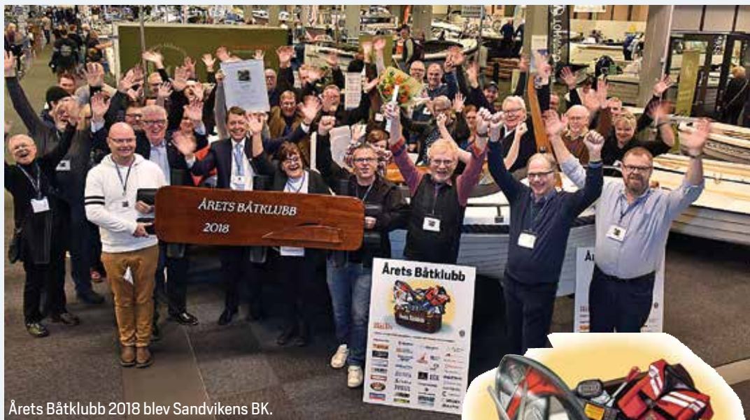
Årets Båtklubb 2018 blev Sandvikens BK.

På hemsidan görs en ansökan med en grundlig motivering om varför er klubb bör vinna. Observera att det inte går att rösta på någon klubb på hemsidan.