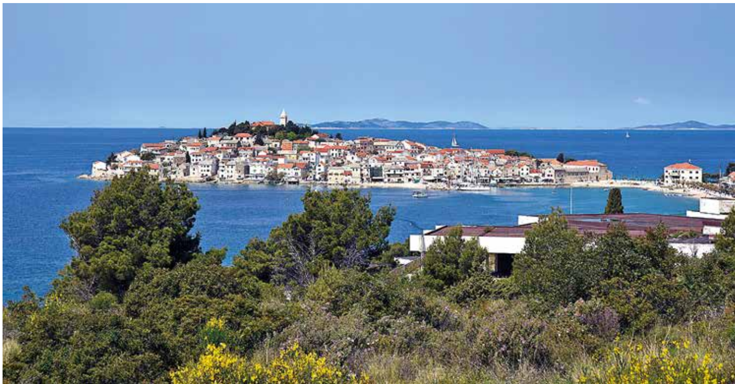
Primošten är en riktig pärla, väl värd ett besök. Mitt i staden finns en populär gästhamn.