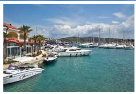
Marina Frapa är den största marinan längs kusten med 462 platser, varav många stora.

Nationalparken Krka är en magnifik upplevelse. Den som kommer med båt kan lägga till i ACI Marina Skradin och därefter ta en turboat till vattenfallen, där man kan promenera runt hela området.