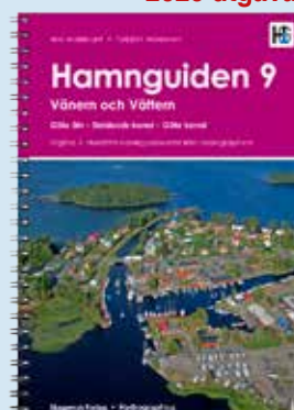
Vänern och Vättern - Göta älv Dalslands kanal - Göta kanal