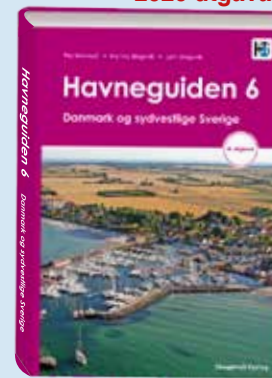
Danmark och SV Sverige