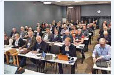
Förra årets Båtriksdag hölls i Linköping. Årets är framskjuten.

Båtriksdagen skjuts fram SVENSKA BÅTTUNIONENS ÅRSMÖTE, Båtriksdagen, skulle ha hållits i Karlstad i början av april. Den har skjutits fram på grund av coronapandemin och hålls troligen i höst.