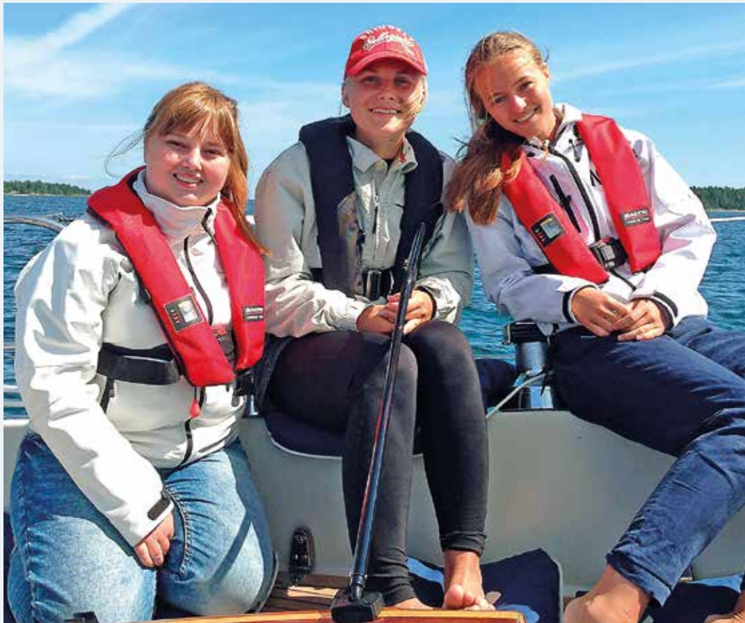
Svenska Båttunionens medlemmar erbjuds en lång rad förmåner i sin avgift.

SVENSKA BÅTTUNIONEN ÄR organisationen för Sveriges båttklubbar. Fler än 900 båttklubbar är anslutna genom 24 regionala båttför-