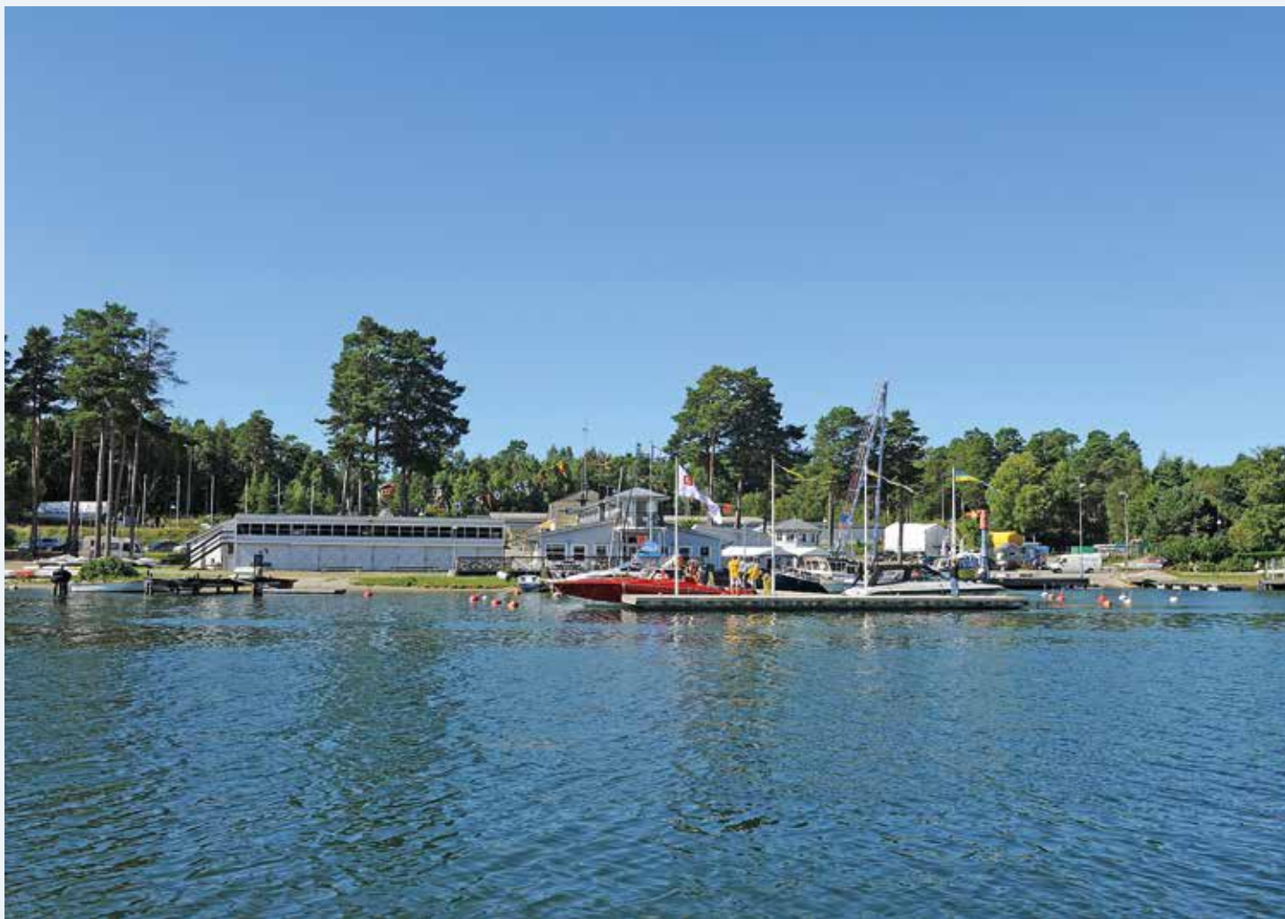
Nynäshamns Segelsällskap har köpt en tomt intill sin nuvarande anläggning och kan därmed expandera med fler båtplatser.