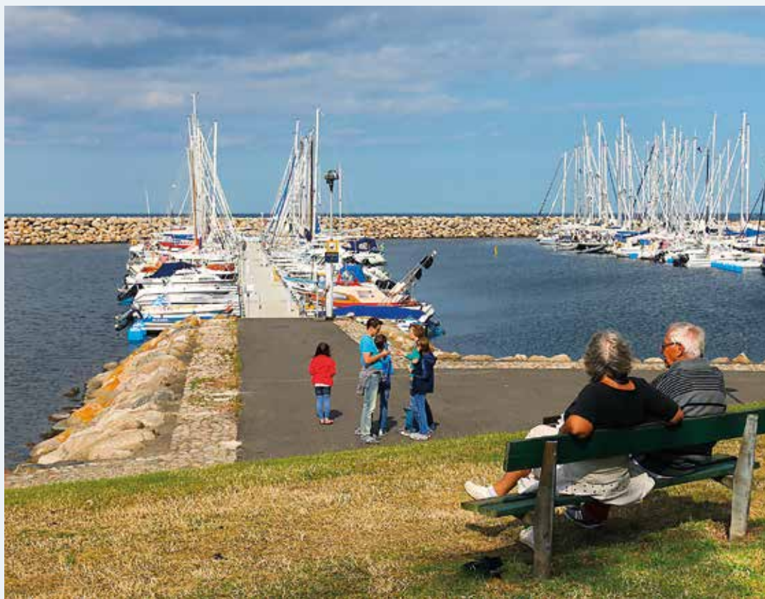
Hamnen i Simrishamn är en av de populäraste på Skånes östra kust.

– Svenska seglare i Öresund får problem. Att segla till Ven går ju, men gränsen till Danmark ligger precis utanför hamnen i Ven. Sen finns Hallands Väderö och Hanö på sydkusten. Det är de öar vi har och det betyder segling på