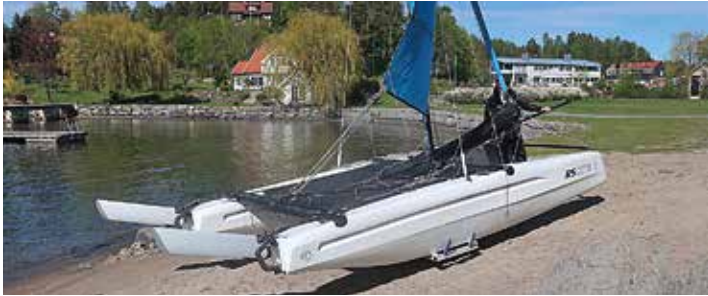
Katamaranen är seglingsklar inom några minuter. Skrovformen och rodren ökar sjösättningen enkel.