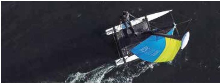
Stabiliteten är en utmaning för en person. Med trapets går det att hantera.

När det kommer en vindby så ökar inte krängningen utan båten ökar bara farten.