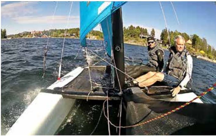
RS Cat 16 går snabbt i vattnet men inte så högt på kryss.