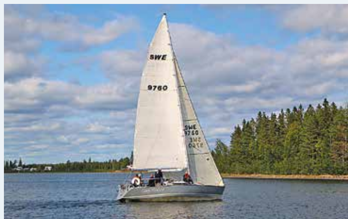
Grey Shadow kryssar som vinnande båt in mot målgång.