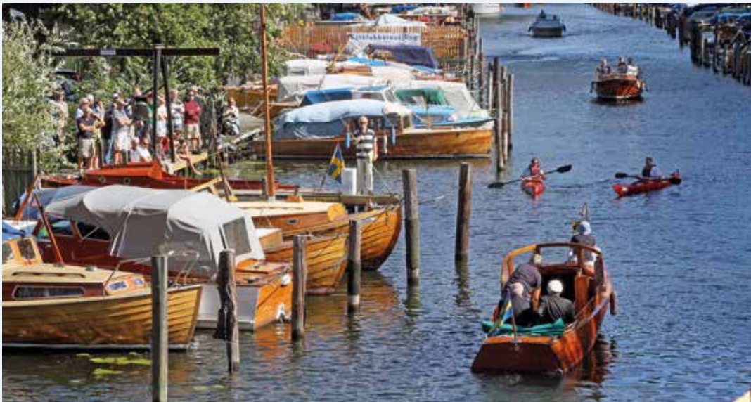
Båtklubbarnas Dag i Stockholm hålls i år 29 augusti.