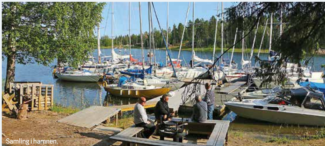
Samling i hamnen.

– På fredagen kommer vi att segla Norrlandscupen i Express och på lördagen blir det sedvanlig SRS-tävling för alla båtar, säger Lundmark, som hoppas att många seglare ska kryssa upp till Piteå i sommar. ☺