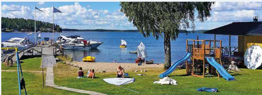
Båttklubbarnas klubböar är kända mötesplatser. Kallaxön är BK Neptuns populära klubbholme.

klubbar och privatpersoner har anpassat sig och nästan uteslutande använder flytbryggor.