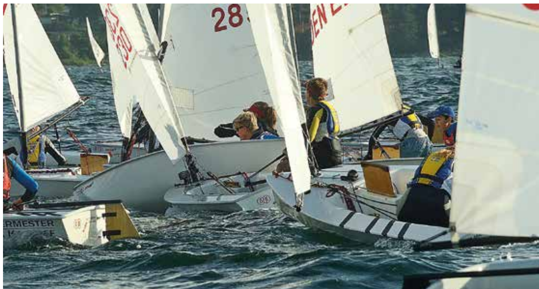
Zoom 8:or under JNOM i Båstad 2018.

UNDER VÅREN HADE de två gemensamma träningar. Det är fem återkommande personer, från