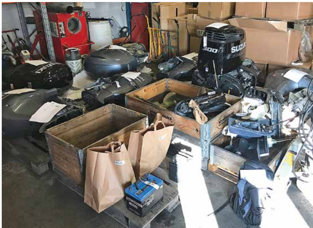
Förrådet i Järfälla med stöldgods. Båtmotorerna ligger delade med växelhus skilda från motorerna.

GRÄNSPOLISEN LÄGGER NER stora resurser för att kunna binda männen till stölderna. Den tredje stölden kan bara ha utförts av de åtalade men för de andra två krävs mera bevis. Alla mobilmaster töms på information och man kan följa