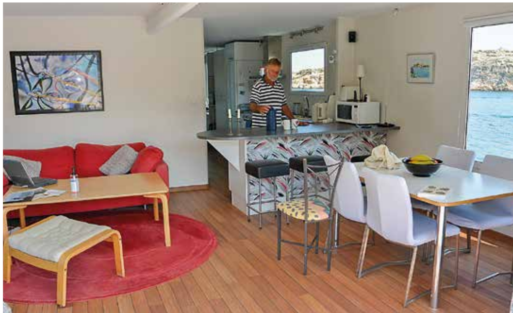
Salong med matplats, bardisk och byssa. Akterut finns owners cabin, arbetsplats, verkstad, gästrum och tvätttrum.

Marinbo kan manövreras från vilken plats som helst med den trådlösa joystick. Fast styrplats med navigationsplats finns på bänken till höger.