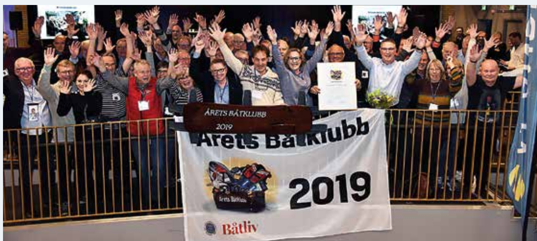
Förra året utsågs Karlstads Segelsällskap till Årets Båtklubb 2019 och nu öppnas möjligheten att delta i kampen om 2020 års Årets Båtklubb. Tävlingen har pågått varje år sedan 2010.