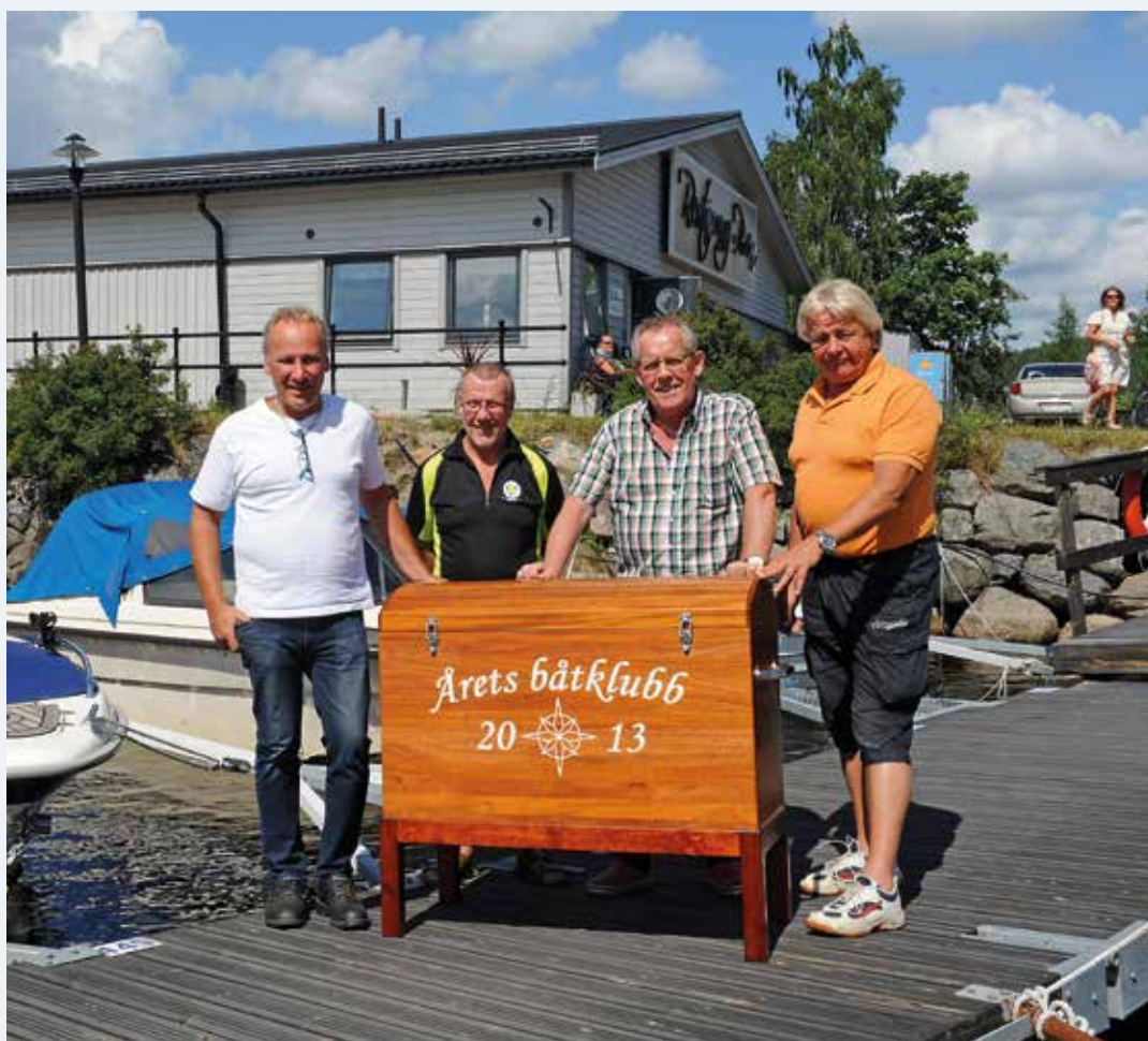
Årets Båtklubb 2013 – Ludvika Motorbåtsklubb.

Även tidningen Båtliv med sex nummer per år ingår i de 70 kr. Svenska Seglarförbundet har köpt in sig med åtta sidor förbundsinformation i varje nummer. Det innebär att också de 164 båtklubbar som är dubbelanslutna till Seglarförbundet kan ta del av den informationen.