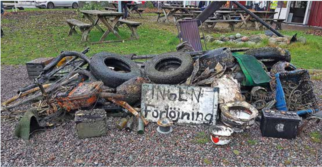
En del av det skräp som plockades upp.