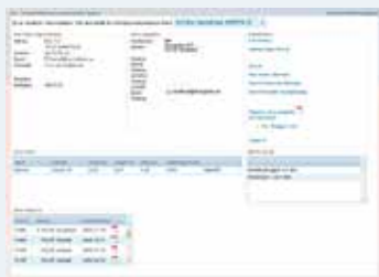
Arbetsmaterial för version 3.

fram genom stegen. Exempel på detta är fakturering, reskontra och bokföring, men det finns många fler sådana processer. Vi ska också utveckla användning av BAS tillsammans med olika ekonomisystem (främst bokföring). Tredje versionen av BAS kommer inte innebära några totalt nya funktioner, däremot förbättringar av befintlig funktionalitet.