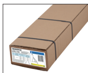
Levereras omonterad i kartong.

Varmgalvaniserad underhållsfri topplatta av stål (rostfri skruv/låsmutter) med integrerade snabbfästen för säkerhetskätting, enkel hantering med lång livslängd.