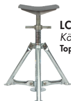
LCKG Kölstöta Top 310x160 mm