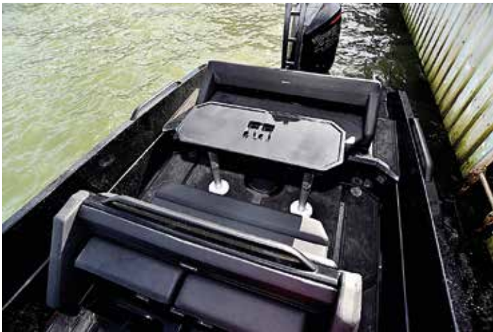
Sittplatsen i aktern med två sittbänkar och bord.

bord med två benstativ. Även för om styrpulpeten finns flera sittplatser på fasta bänkar plus ett stort, öppet utrymme.