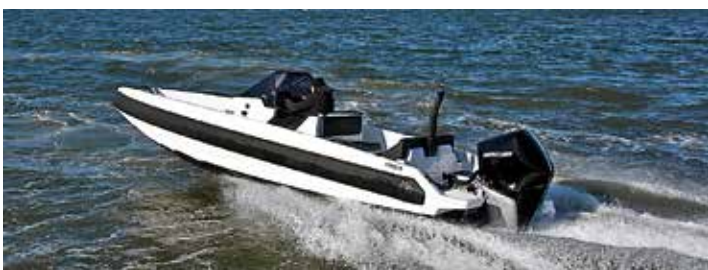
IRON 707 delar de fina sjöegenskaperna med övriga båtar i serien.

NYA OCH STÖRRE modeller är redan på gång (1027 och 1127). Samtidigt planeras för tillval som T-Top och kupé. ☺