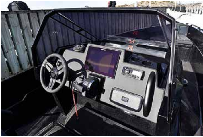
Förarplatsen är praktisk och funktionell.